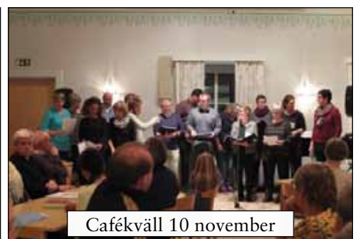
Cafékväll 10 november