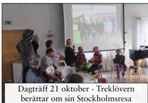
Dagträff 21 oktober - Treklövern berättar om sin Stockholmsresa