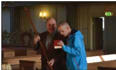
Söndagsgudstjänst 11 oktober