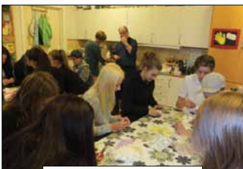
Konfirmander och ledare