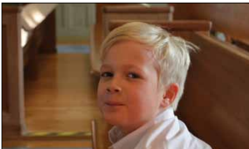
Gudstjänst för stora och små 3 oktober