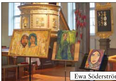
Ewa Söderström visar sina bilder 18 oktober