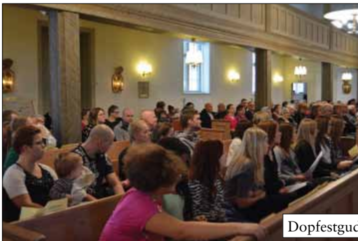
Dopfestgudstjänst 2 februari