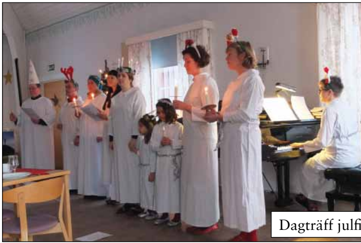
Dagträff julfirande 18 december