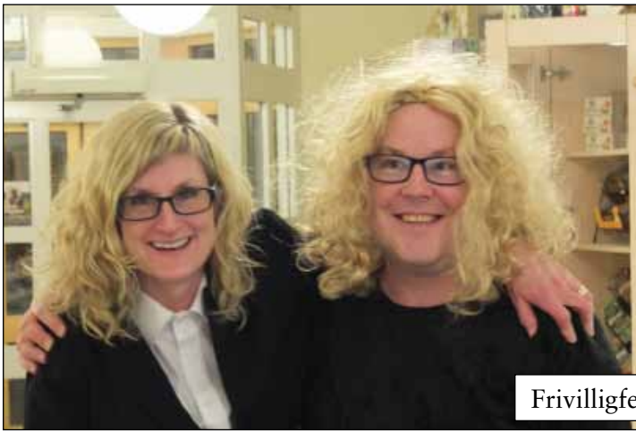
Frivilligfest 21 november