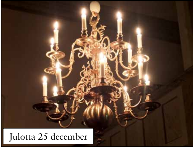
Julotta 25 december