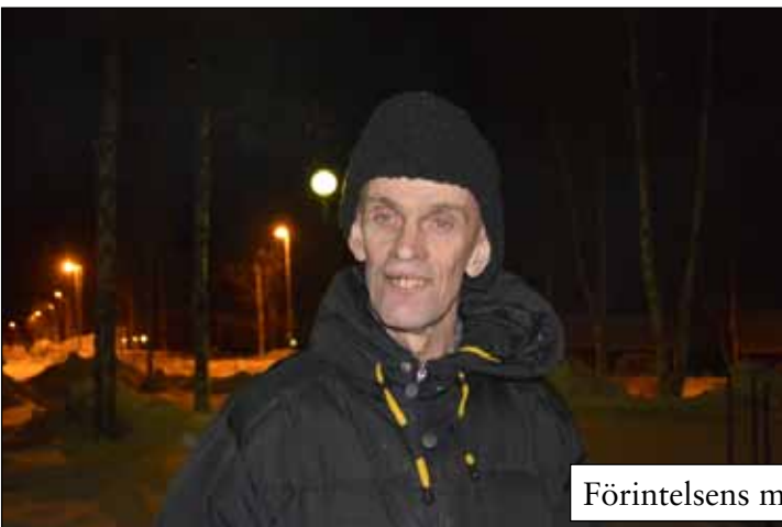
Förintelsens minnesdag 27 januari