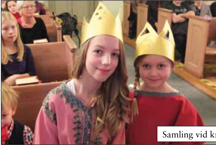
Samling vid krubban 24 december