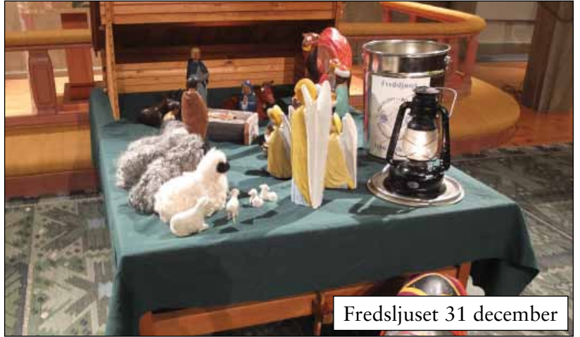
Fredsljuset 31 december