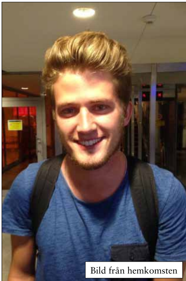
Bild från hemkomsten

När själva presentationen var slut gav jag mig även på att försöka lära mina åhörare en sång jag fick lära mig av ungdomsgruppen i min första värdförsamling i Brasilien. Då det inte fanns en chans att någon skulle känna igen sången, och texten var på portugisiska var jag osäker på om inslaget skulle uppskattas, men min oro visade sig obefogad. Gruppen, som efter endast en dag tillsammans var bekväma i varandras sällskap, sjöng med höga röster, leenden på läpparna och gjorde sitt bästa för att hinna med de nyinlärdade rörelserna. Där jag satt bakom pianot, fick jag svårt att fokusera mig på mitt pianospelande då jag bara ville se på de uppskattande blickar jag fick, och lyssna på deras skratt. I den stunden kändes det som om en hel del oro och nervositet jag haft inför våren rann av mig, och nu efteråt ser jag fram emot kommande uppdrag på ett helt nytt sätt.