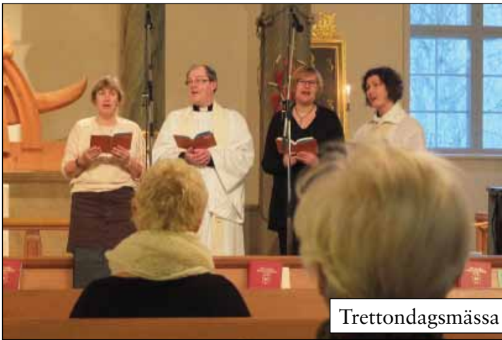
Trettondagsmessa med grötlunch 6 januari