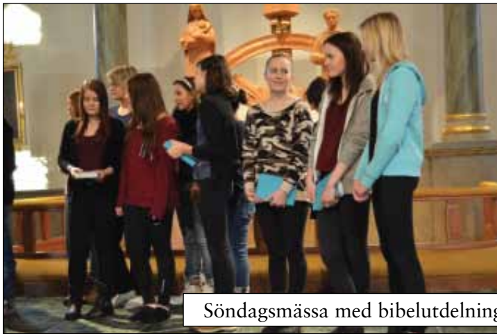
Söndagsmessa med bibelutdelning till konfirmander 19 januari