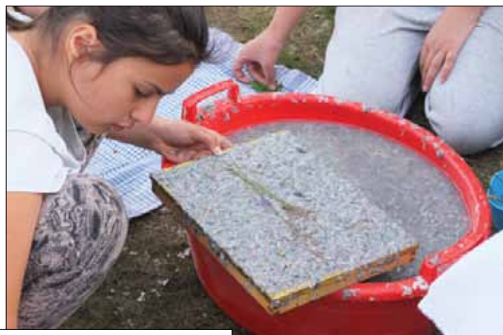
Läger i Gunnarsbyn/Rikti-Dockas 13-15 augusti