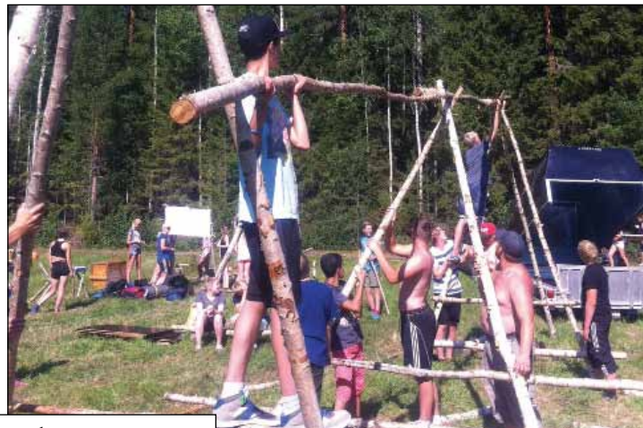
Patrullriks i Gärdsmark 2-9 augusti