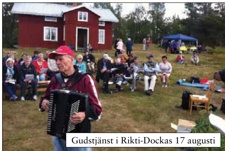
Gudstjänst i Rikti-Dockas 17 augusti