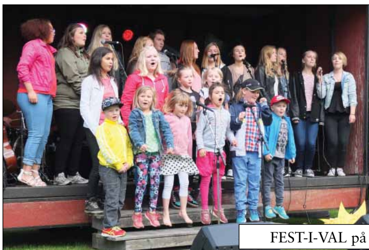
FEST-I-VAL på kyrkbacken 25 juni