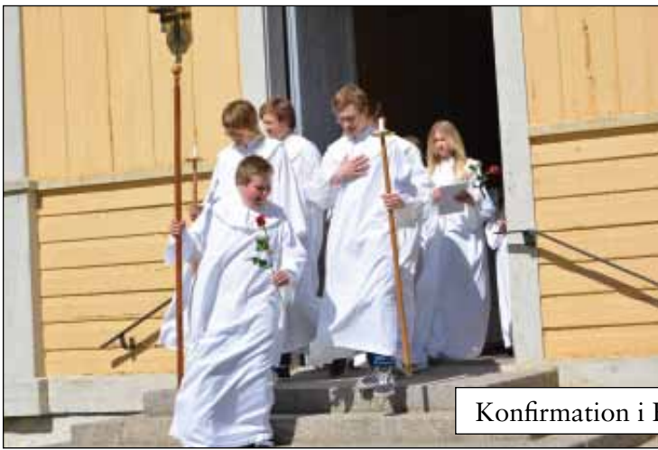
Konfirmation i Råneå kyrka 25 maj