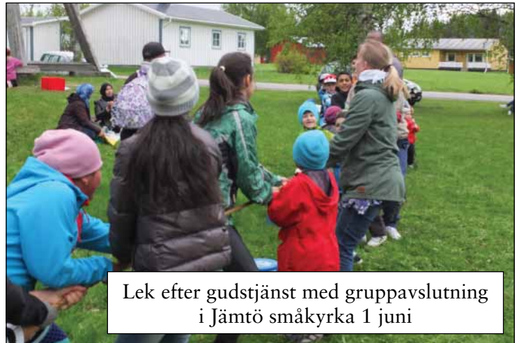
Lek efter gudstjänst med gruppavslutning i Jämtö småkyrka 1 juni