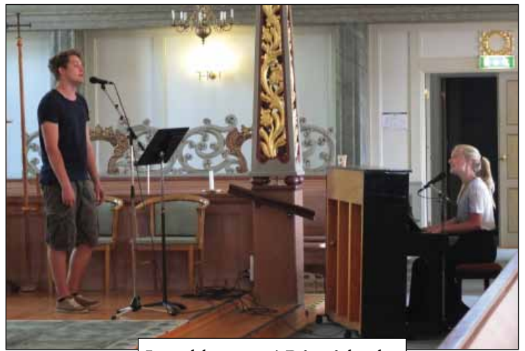
Lunchkonsert i Råneå kyrka 30 juli