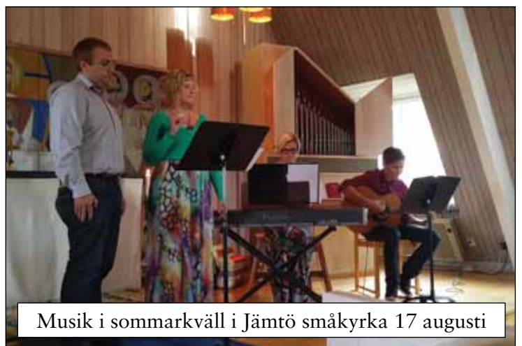
Musik i sommarkväll i Jämtö småkyrka 17 augusti