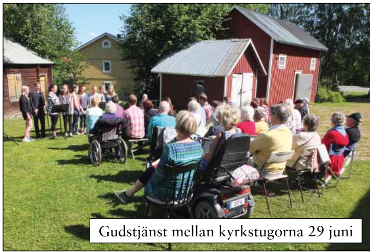
Gudstjänst mellan kyrkstugorna 29 juni