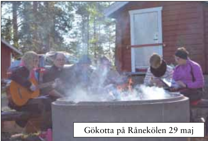
Gökotta på Rånekölen 29 maj