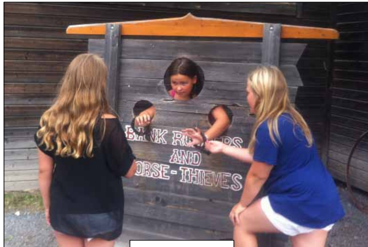
Western farm 31 juli