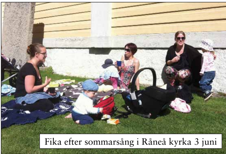
Fika efter sommarsång i Råneå kyrka 3 juni