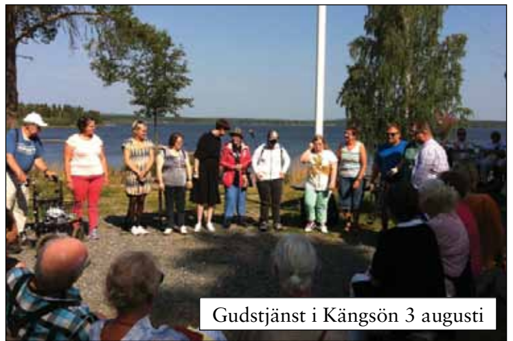
Gudstjänst i Kängsön 3 augusti