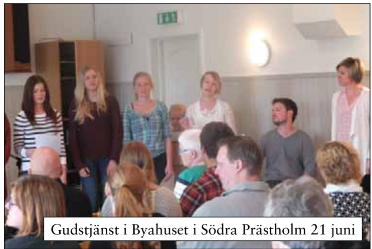
Gudstjänst i Byahuset i Södra Prästhalm 21 juni