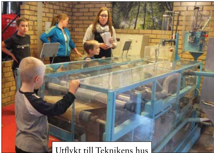
Utflykt till Teknikens hus 30 oktober