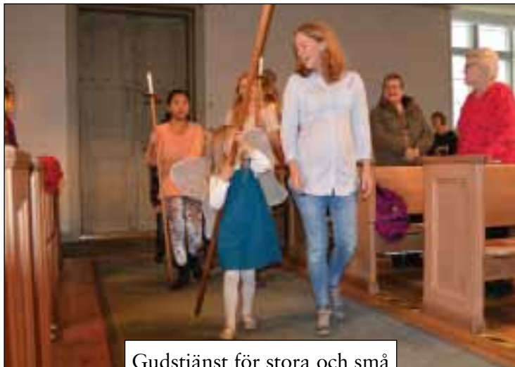
Gudstjänst för stora och små med änglakör 5 oktober