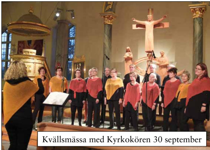
Kvällsmässa med Kyrkokören 30 september