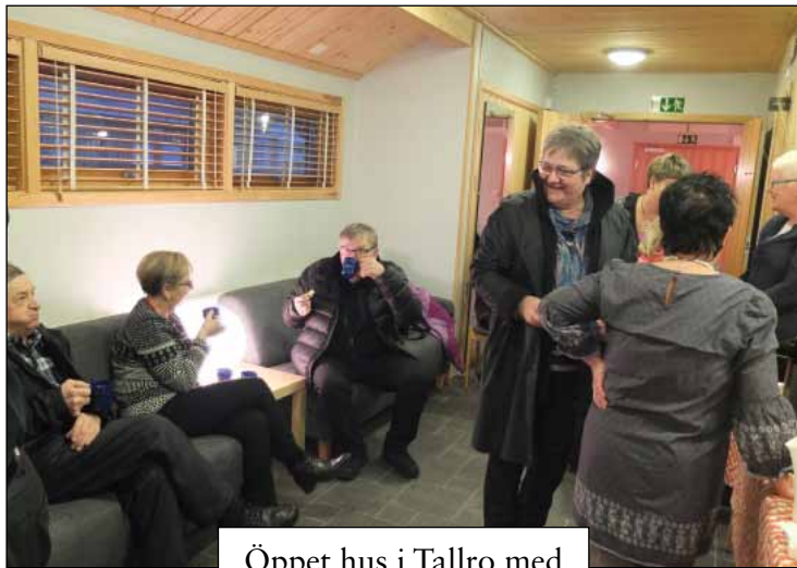
Öppet hus i Tallro med musikandakt 31 oktober