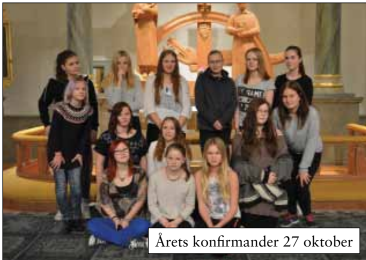
Årets konfirmander 27 oktober