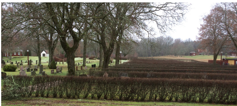
Överblick över nya kyrkogården, sett från söder. Bårhuset och församlingsbhemmet skymtar längst bort t v i bilden.