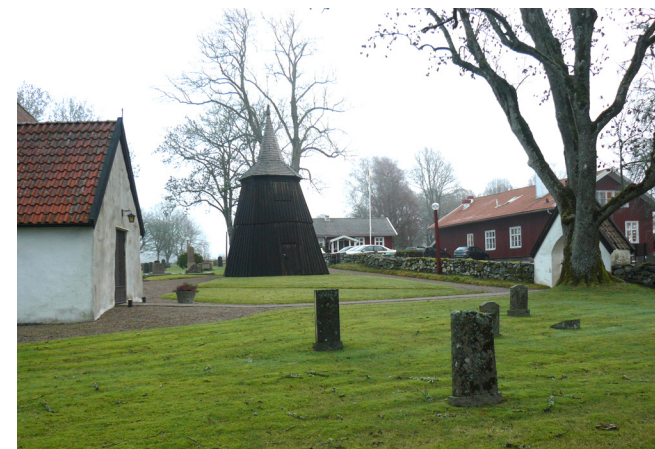
Gamla kyrkogården. Utanför muren i söder finns skola och församlingshem.

Det finns tre entréer till den gamla kyrkogården, samtliga från söder. Mitt för kyrkans huvudentré är en putsad stiglucka med tegeltäckt sadeltak och svartmålade pargrindar i smide. Öster om denna, mitt för klockstapeln, finns en enkelgrind i svartmålat smide mellan stenstolpar. Vid församlingshemmet finns en pargrind i svartmålat smide mellan stenstolpar, troligen satt den tidigare i öster, innan