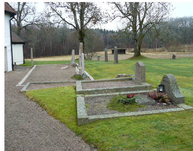
Kyrkogården har ett fåtal grusgravar. Några av dem ligger i ett samlat område öster om koret.