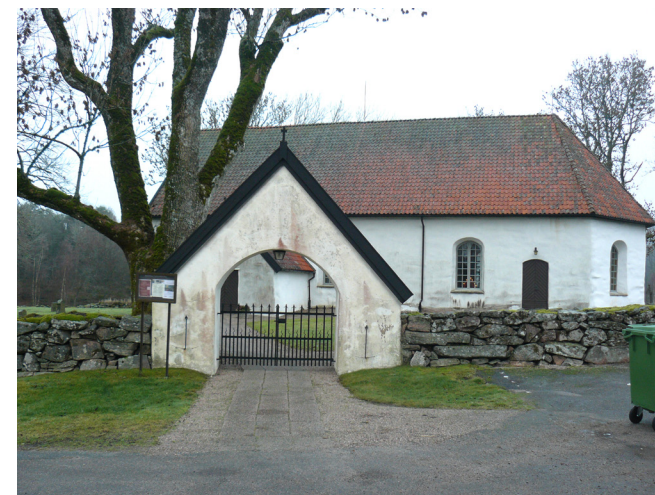
Huvudentrén från söder, genom en putsad stiglucka.