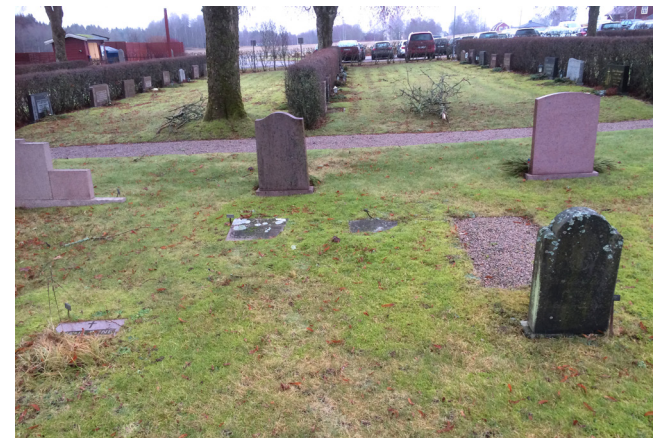
Område med barngravar på nya kyrkogården.