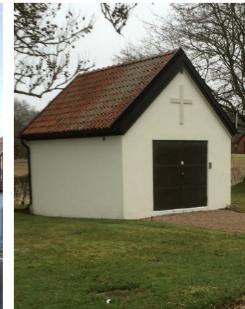
Bårhuset byggdes 1966.