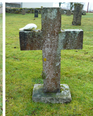
Kalkstenskors, G 8 t v och G 14 t h.