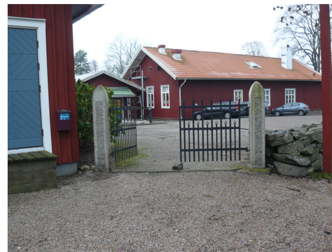
Skola och förskola ligger söder om kyrkan. Byggnaden närmast t v i bild är församlingshemmet.