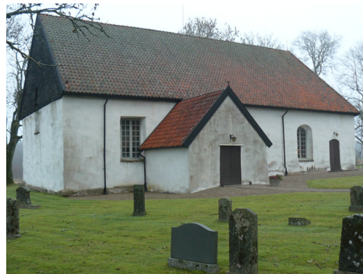
Kyrkans södra fasad.