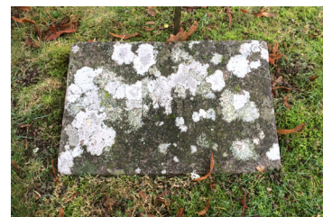
En liten liggare (nr 432) med inskriptionen Mor.