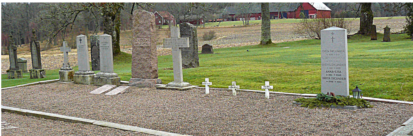
Dicanderska familjegraven omfattar 11 stenar av olika ålder, daterade från 1841 till 1997.

senast gravsatta är Brita Dicander 1906-1997 . Inom gravanläggningen finns också tre små vita kors resta över barn.