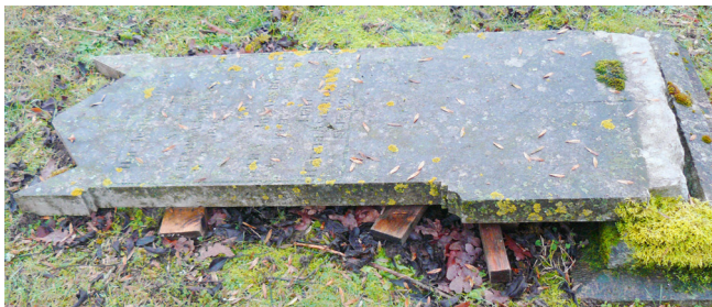
G 3, gravsten rest över två systrar under andra halvan av 1800-talet.

Magra kyrka och kyrkogård ligger i ett litet sockencentrum, omgivet av vägar och med skola, förskola och församlingshem i direkt anslutning till kyrkogården. Karaktären av gammal lantkyrkogård tydliggörs av den medeltida kyrkan utan torn, klockstapeln samt gravvårdarnas utformning och placering - de står glest utspridda, flera av dem är