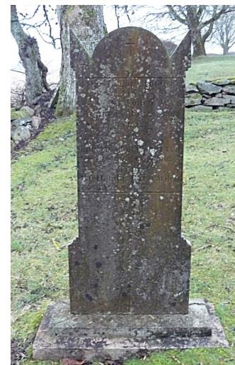
G 5 är rest över två syskon, som dog med ett års mellanrum.

Kyrkogårdens mest påkostade gravanläggning är G 40, den Dicanderska familjegraven, som omfattar 11 stenar inom en stenram. Släkten Dicander ägde gården Upplo från början av 1800-talet. Gravvårdarna är från olika tider, där en av dem är högrest och grovhuggen med inskriptionen Dicanderska familjegraven . Den äldsta är daterad 1841, och rest till minne av Bokhållaren herr Anton Robert Dicander, som dog endast 28 år gammal. För tidigt från nära anhörige hvilkas saknad lefver lika länge med dem lyder en inskription på stenen. Den