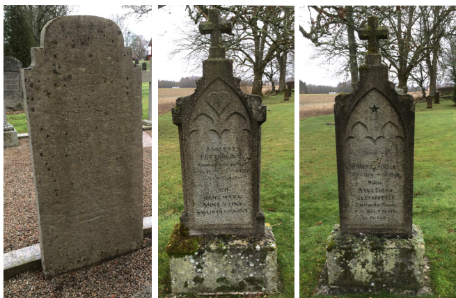
Den äldsta gravvården är från 1797.