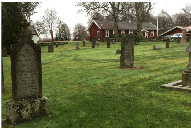
Öster om kyrkan finns flera äldre gravvårdar i kalksten. De är viktiga för upplevelsen av den ålderdomliga kyrkogården.