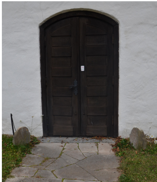
INR 1 och INR 2, på var sida om dörren.