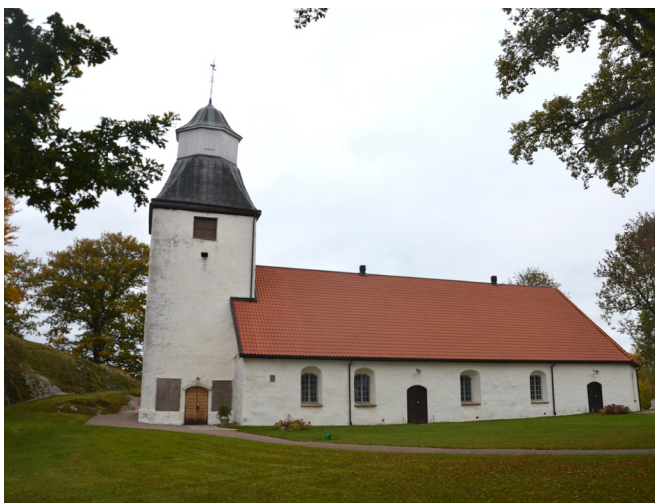
Kyrkans södra sida. Den här delen av kyrkogården har en ålderdomlig karaktär.