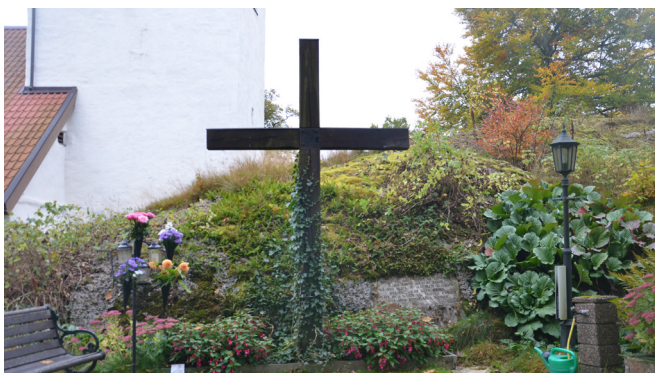
Minneslund på bergknallen.

Kyrkogården har en orgelbunden form, med kyrkan placerad i den södra delen. Årsringarna är tydligt avläsbara genom att södra delen har en ålderdomlig karaktär, medan norra delen präglas av ett modernt uttryck med raka kvartersindelningar och rygghäckar i långa rader. Här står gravarna mestadels glest och är låga. Karakteristiskt för kyrkogården är bergknallen som ligger väster om kyrkan. Här är askgravlund och minneslund/meditationsplats placerade, och nås via slingrande stigar runt berget. Minneslund/meditationsplatsen ligger högt och med utblick över den stora kyrkogården i norr. Den är utformad med bänkar och ett högt, brunbetsat kors.