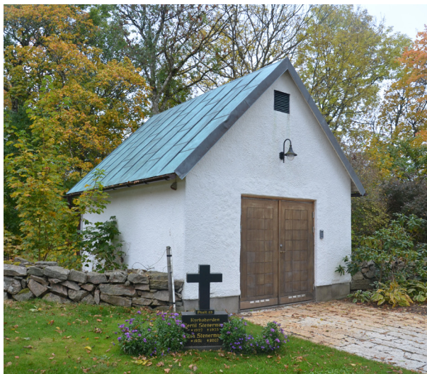
Bårhuset från 1966.