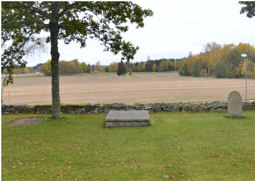
I kyrkogårdens sydvästra hörn finns kyrkogårdens äldsta gravvårdar.