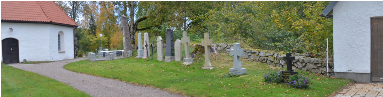
Längs östra muren finns den så kallade "prästraden" med tolv gravvårdar resta över kyrkoherdar, präster och komministrar från 1807 till 1987.