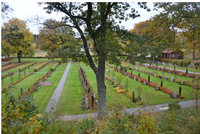
Överblick kyrkogårdens norra del, anlagd under 1980-talet.