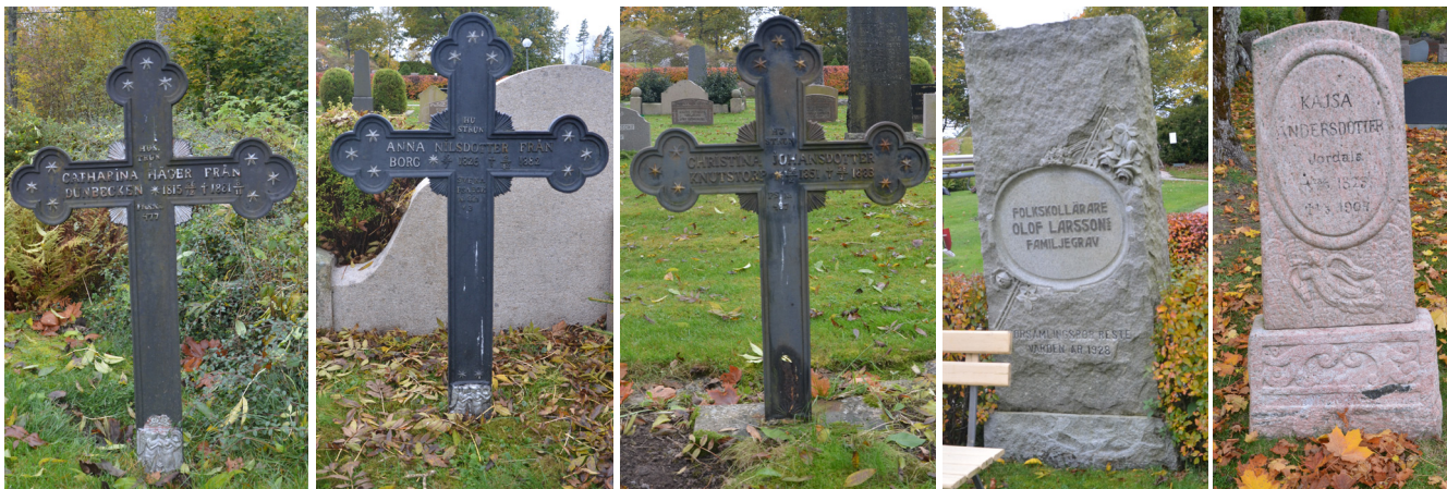
Fr v: INR 6, I 104 och INR 8 är likadant utformade, tillverkade av en lokal smed. Alla tre är resta till minne av kvinnor.