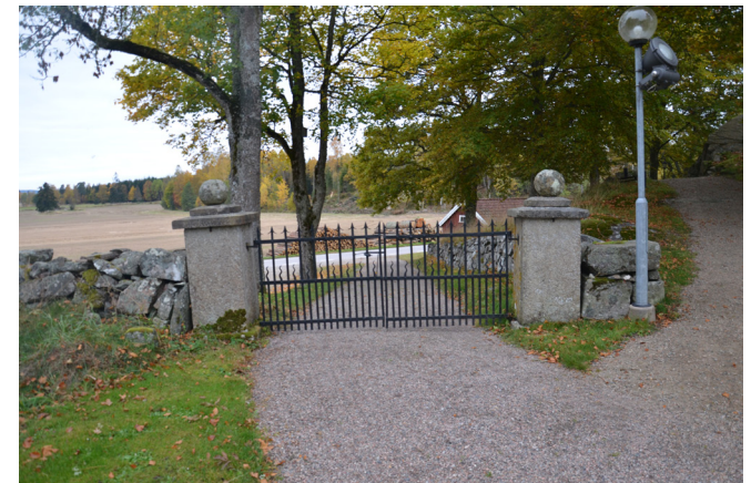
Grind i väster, mot parkeringen. Till höger om grinden syns stigen upp på bergknallen där askgravlund och minneslund finns.

Kyrkan omgärdas till stora delar av träd som är placerade utmed murarna. I den nya delen är det lönn och lind. Alm och ask förekommer, i den gamla delen längst i söder och i anslutning till nya kyrkogården finns några ekar. Enstaka träd finns också inne på kyrkogården i anslutning till kvartersgränser.