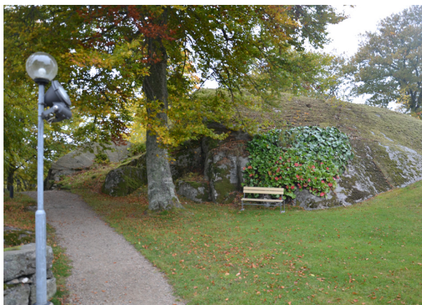
Bergknalle väster om kyrkan.