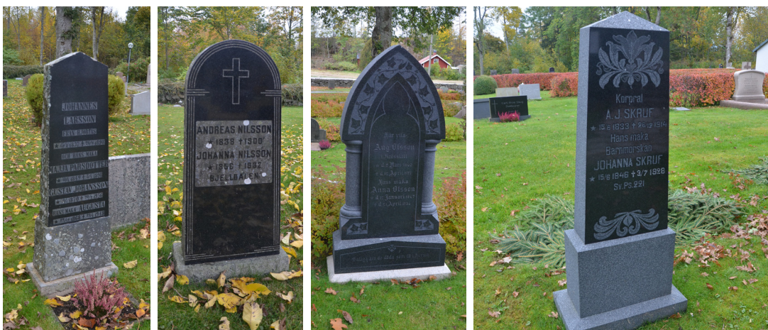
Gravvård III 21 daterad 1898, III 90 samt VI 1.