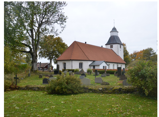
Översikt från norr.