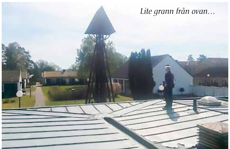
Lite grann från ovan...