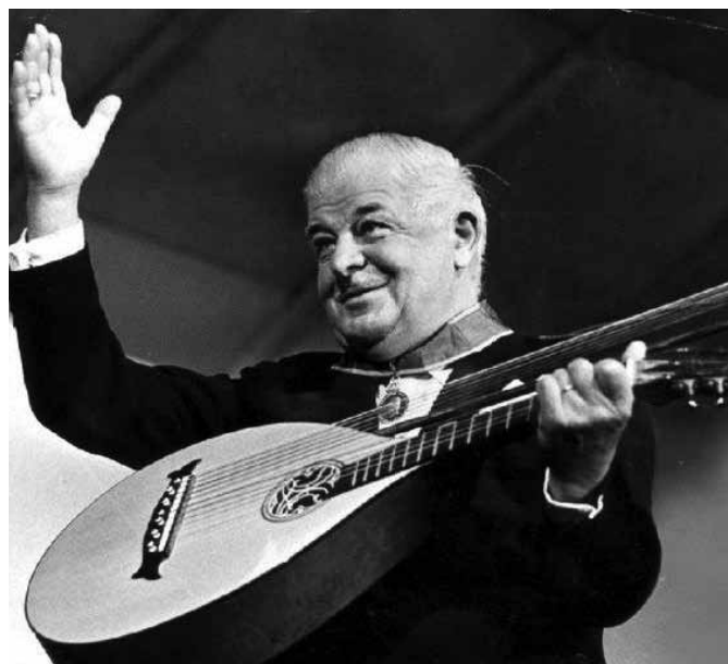
Evert Taube