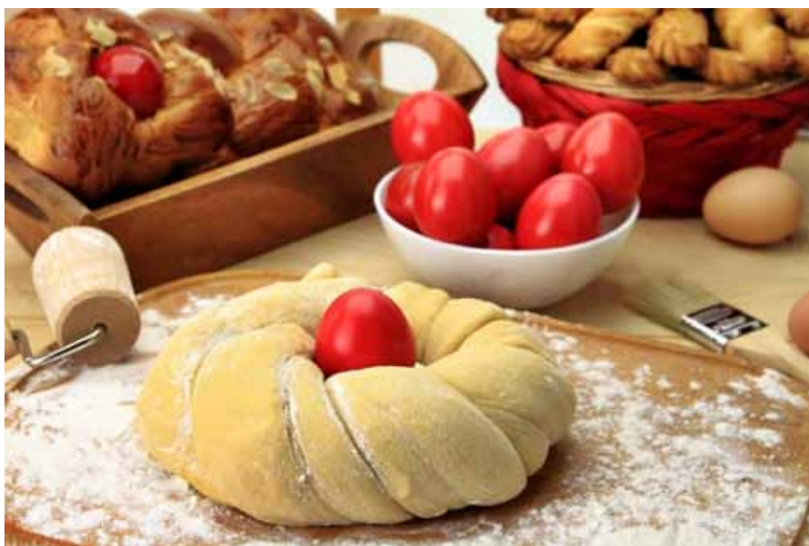
Ortodox betyder ”den rätta läran”. Den ortodoxa kyrkan består av flera nationella kyrkor, främst i Östeuropa och Ryssland. Till påsk bakar man traditionellt bröd och målar äggen röda.