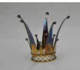
Västra Fågelvik Kronan är tillverkad på 1950-talet och skänkt av syföreningen i Västra Fågelvik.