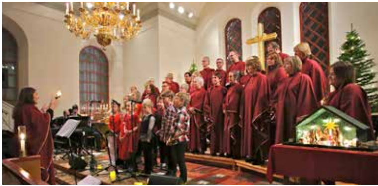
Holy Inspirations traditionella julkonsert i Västra Fågelvik Det blev två fullsatta föreställningar när Holy Inspiration bjöd på sin traditionella julkonsert.