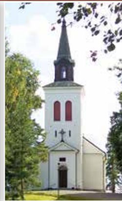
VÄSTRA FÅGELVIKS KYRKA