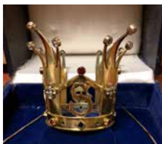
Sillerud Kronan överlämnades till Silleruds församling 27 november 1949 av Silleruds flickscoutkår.