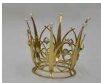
Östervallskog Under 50- och 60-talet fanns en flickgrupp som var aktiv inom kyrkan i Östervallskog. Flickgruppen skänkte brudkronan till kyrkan under den här tiden. Vad vi vet är att kronan användes vid en vigsel 1971.