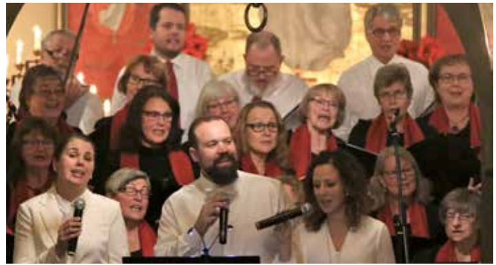
Jul, jul strålande jul Välbesökt julkonsert i Blomskogs kyrka.