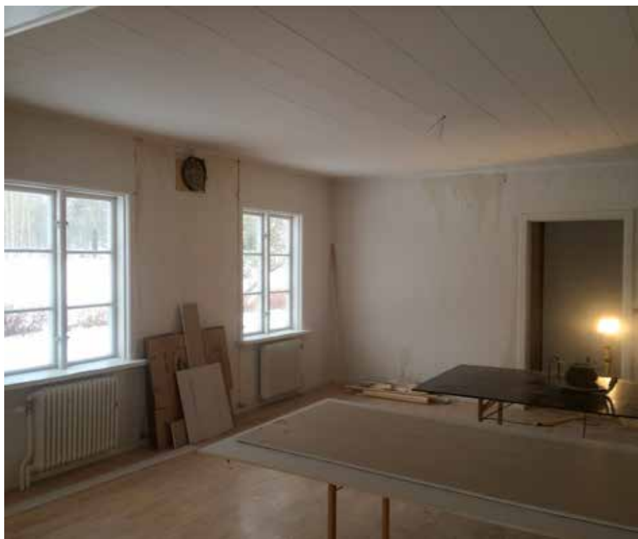
Här ser vi stora salen under pågående renovering.

Under tiden som renoveringen pågår är församlingshemmet stängt och kyrkoherde Rune Wallmyr har inlett ett samarbete med Equmeniakyrkan om att få låna Holmegården.