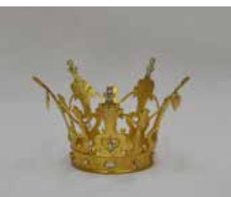
Töcksmark Kronan är inköpt 1945 från juvelerarfirman Wahlberg i Karlstad/Gävle.