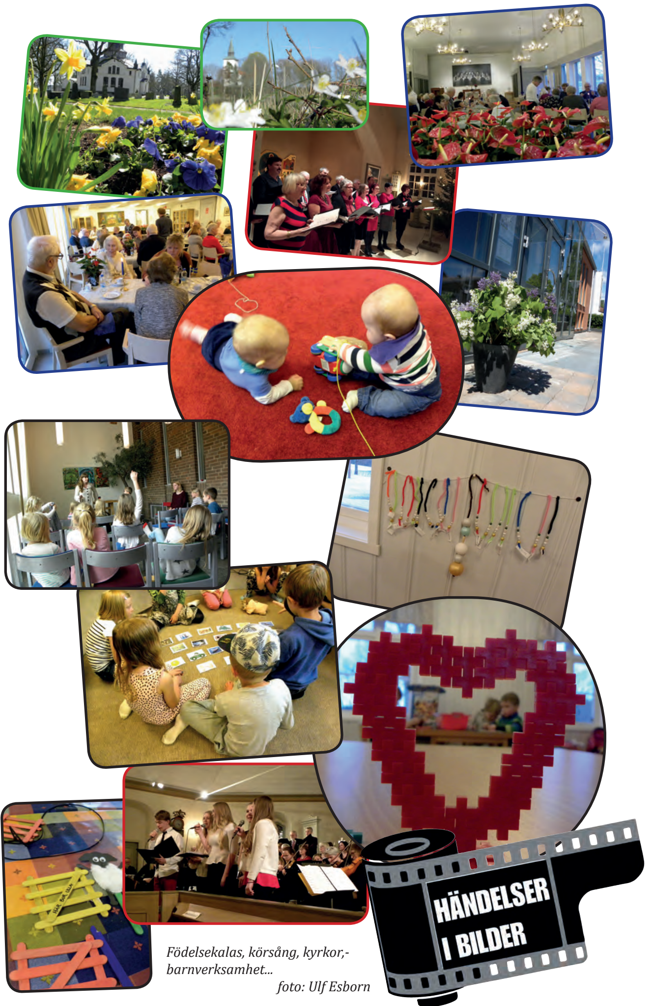
Födelsekalas, körsång, kyrkor, barnverksamhet...