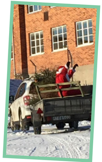
"Men till näst år igen, kommer han vår gamle vän, för det har han lovat..."