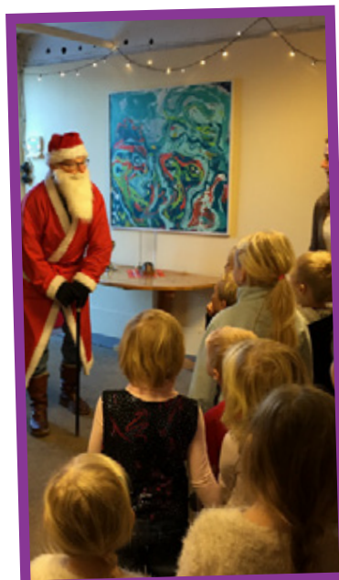
Tomten kommer... spänd förväntan på alla barn