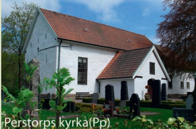
Perstorps kyrka (Pp)