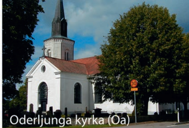
Oderljunga kyrka (Oa)