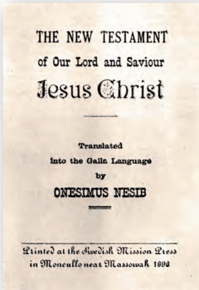
En av Onesimus stora bidrag var att översätta Nya Testamentet till Galla.

skydd och stöd. Nu kan han också börja bygga upp en mer strukturerad verksamhet av sjukvård, undervisning och gudstjänst. Elevantalet fördubblas på bara några år och han lär upp lokala lärare.