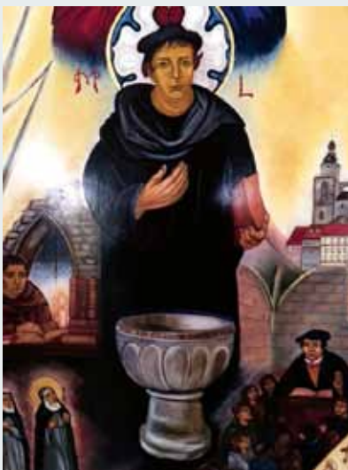
Martin Luther och Tensta kyrkas dopfont.