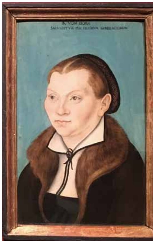
Katarina von Bora

förhör och han fick senare fly för sitt liv och var tvungen att gömma sig.