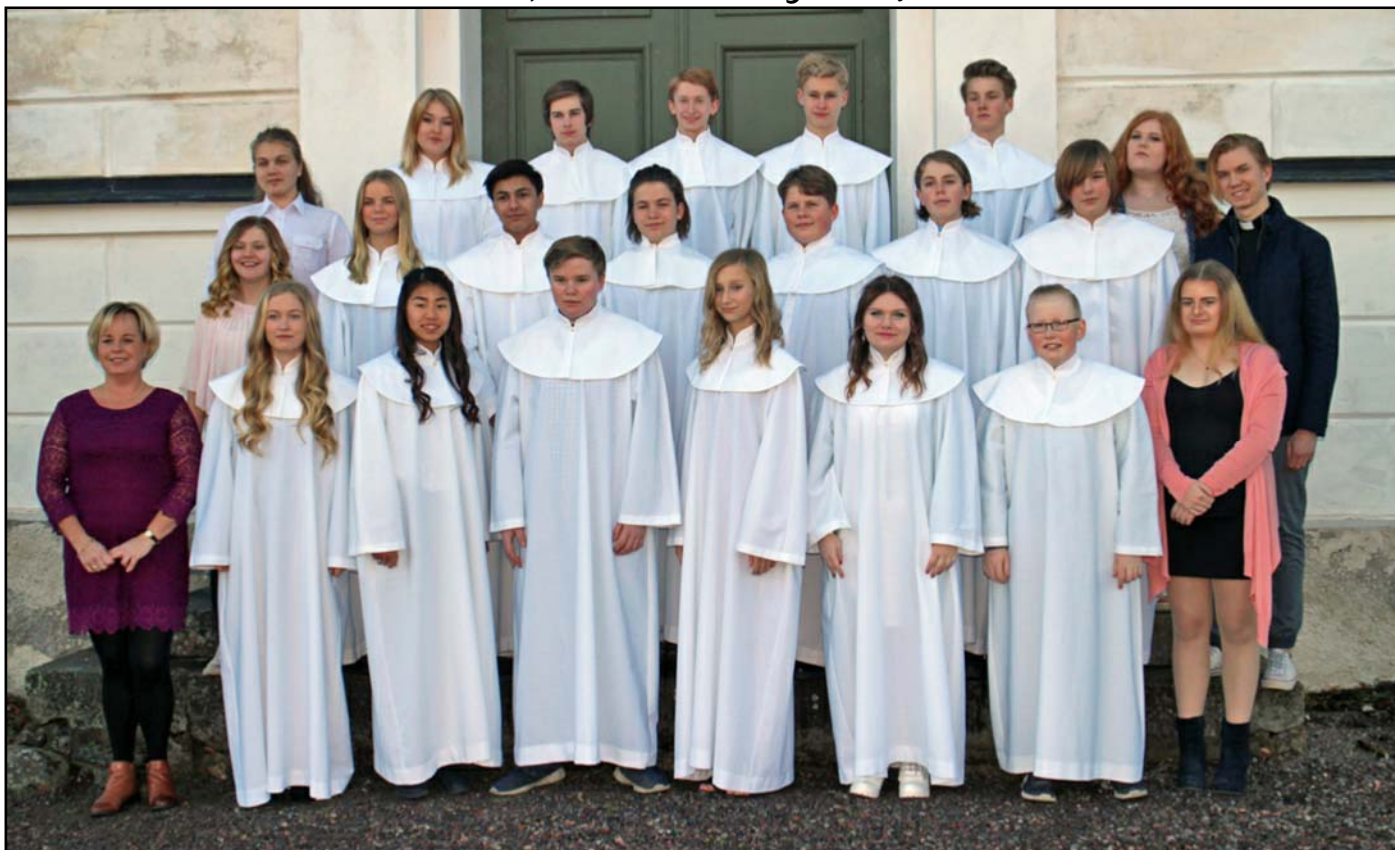
Resekonfirmanderna "På tur" med konfirmandteamet på norra sidan av Mogata kyrka 27 januari 2017.

Den 21 januari konfirmerades 17 härliga ungdomar i Mogata kyrka. Kanske hör du på gruppens namn "På Tur" att vi har varit en resegrupp som åkt på olika turer både nära och långt borta. Vi har träffats under en kort och intensiv period mellan september och januari. Våra turer har gått till