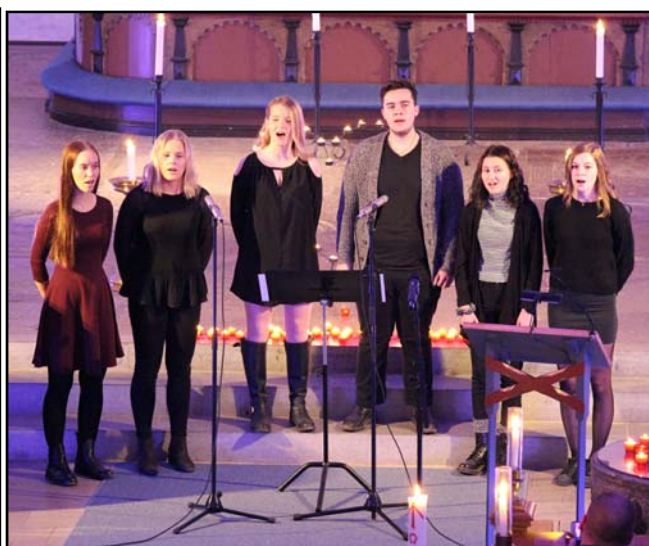
Kulturskolans sånggrupp svarade för körsångerna