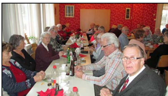
Lunchträff i Börrums bygdegård i december 2016.

Alla lunchträffar är torsdagar och börjar kl. 12. Luncherna kostar 50 kr. Föranmälan tel. 358 00 senast måndagen före lunchträffen i Drothems församlingshem.