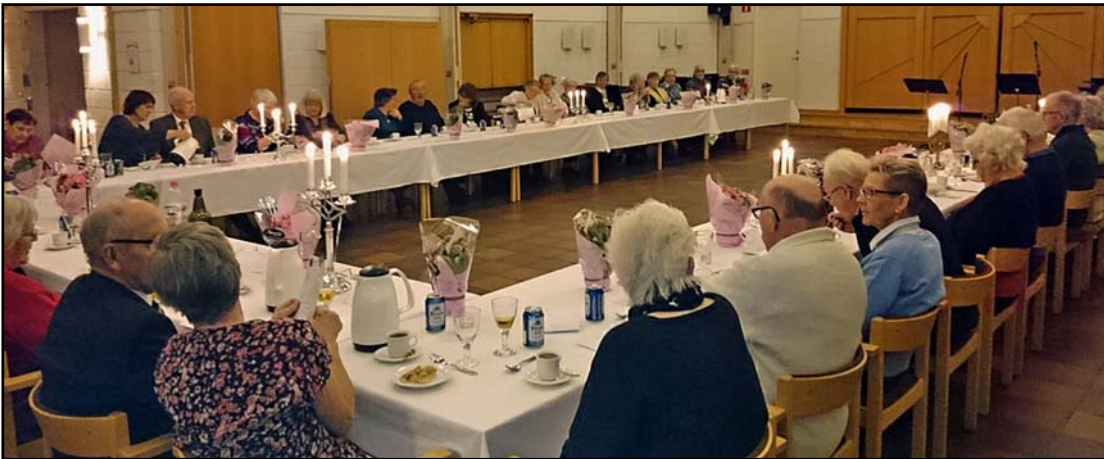
Bild till vänster: 80-åringarna vid middagen i S:t Laurentii församlingshem.