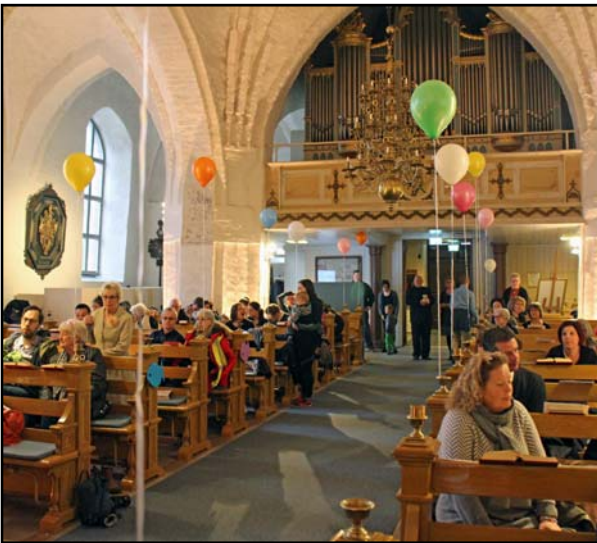
En något ovan syn med ballonger mötte besökarna i kyrkan.

Redan vid ankomsten till kyrkan möttes de besökande av färgglada ballonger och mängder av glada och lekfulla barn. Alla som döpts under förra året var inbjudna med sina föräldrar och syskon till dopfest i S:t Laurentii kyrka. På programmet stod