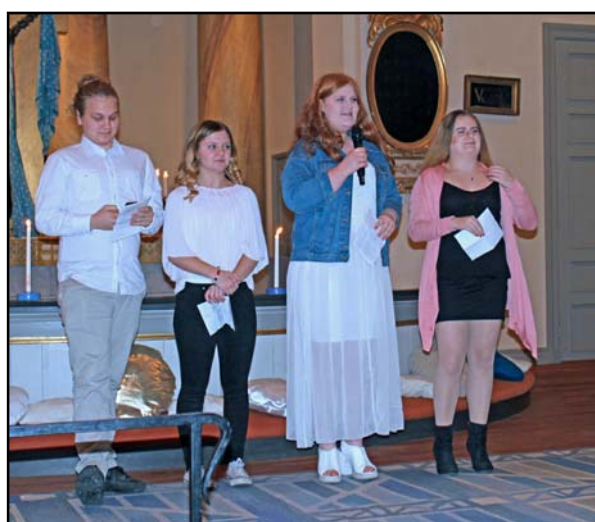
Bild ovan till vänster: Konfirmanderna tågar in i en fullsatt Mogata kyrka.