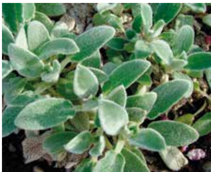
Lammöron, Stachys byzantina