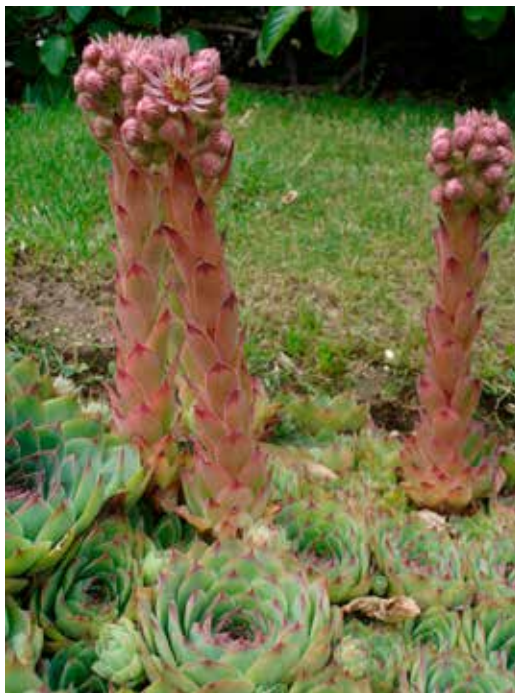
Taklök Sempervivum tectorum