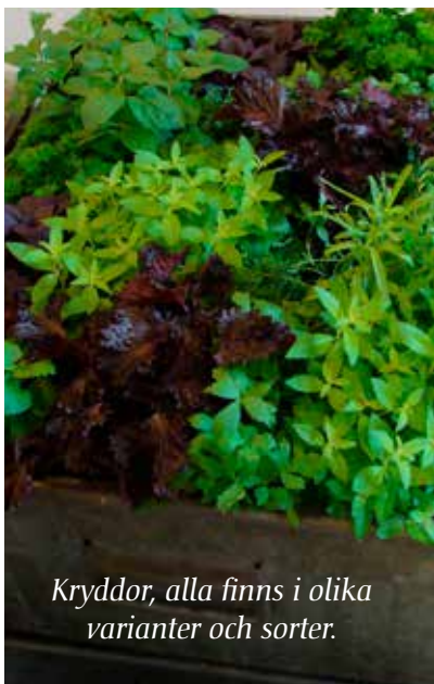
Kryddor, alla finns i olika varianter och sorter.