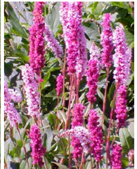
Bergormrot, Polygonum affine