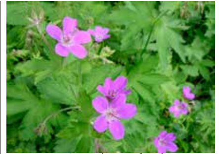
Näva Geranium sylvaticum .