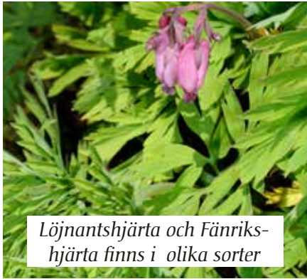
Löjnantshjärta och Fänriks- hjärta finns i olika sorter