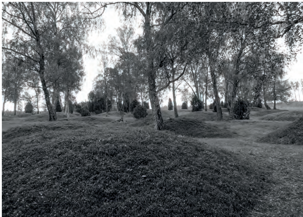
Gravfält från yngre järnålder, tiden före kristendomens införande i Sverige. Gravfältet är beläget i Ljungby kommun, intill Hallsjö kyrkoruin.

Medeltidens kyrkogårdar var främst formade utifrån nyttoaspekten, dels för att bereda de avlidna plats i jorden, dels för att kunna användas som marknadsplatser. Marken var bevuxen med gräs, som klockaren kunde ta