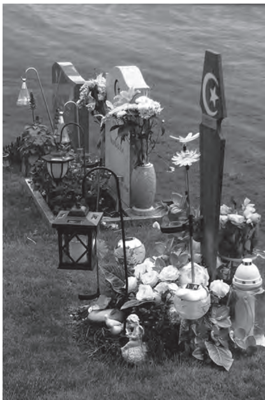
Några muslimska gravplatser på Västra kyrkogården i Halmstad. De döda ska begravas utan dröjsmål och vila på höger sida med ansiktet vänt mot Mecka.

Mångkulturen på svenska kyrkogårdar är inget nytt. Redan i 1686 års kyrkolag hävdades att de som tillhörde annan religion och dog i Sverige skulle "njuta fuller kyrkogård och lägerstad". Idag finns ett lagstadgat krav på att församlingar som är huvudmän för begravningsverksamheten ska tillhandahålla särskilda gravplatser för dem som inte tillhör något kristet trossamfund. Särskilda gravplatser för bland annat muslimer, judar, romer och bahaier finns som avskilda kvarter på många allmänna begravningsplatser.