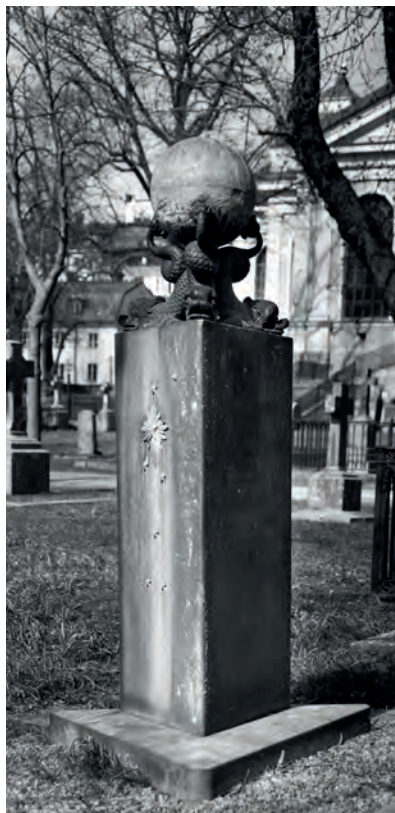
På Katarina kyrkogård i Stockholm finns detta ståtliga gravmonument i sten och metall.