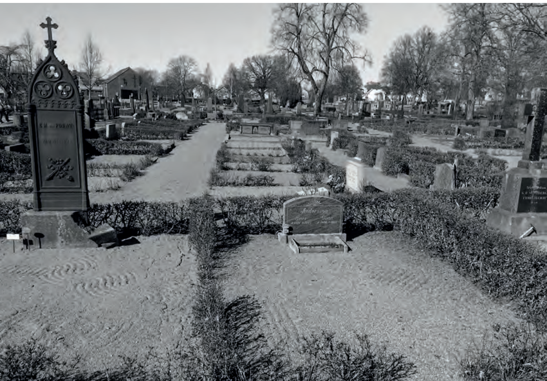
Ett helt kvarter med grusgravar i Eksjö. Modet med krattade gravar uppstod kring förra sekelskiftet. Till vänster i bild ett högrest gjutjärnsmonument.

investera i en påkostad gravanordning med gravstenen i fokus. Nyttjanderätten till en gravplats gick i arv, ett system som upphörde så sent som 1991.