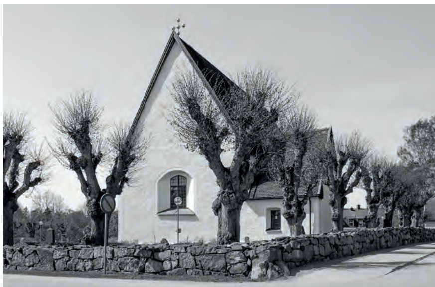
Lindarna intill kyrkogårdsmuren vid Täby kyrka planterades 1785 för att markera den dåvarande kyrkogårdens omfattning. Lindarna är ett tidigt exempel på medvetet gestaltad vegetation på en begravningsplats.