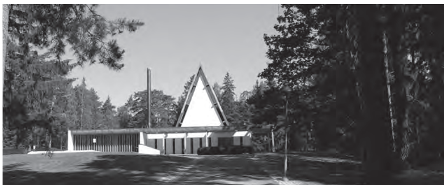
Silverdalskapellet i Söllentuna invigdes 1969. I källarplanet ryms ett krematorium med två ugnar. År 2016 kremerades i Sverige nästan åtta av tio avlidna.

Givetvis insåg förkämparna för kremationens införande att behovet av mark för gravsättning skulle minska, men att denna begängelsemetod skulle påverka arkitekturen och karaktären på nya begravningsplatser blev en oanad konsekvens. För en urngravplats gällde – och gäller alltjämt – samma rättigheter och skyldigheter avseende gravrätten som för en kistgravplats. Urngravplatsen är dock betydligt mindre till ytan och gravanordningen blir därför mer måttfull och bättre anpassad till den nya skalan.