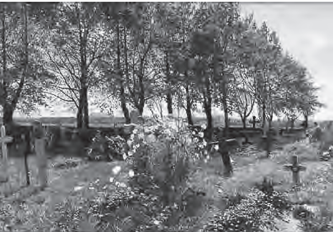
Kyrkogård i sommarsol. En målning av Gottfrid Kallstenius från 1887. Bilden visar en landsortskyrkogård innan gravstenar blev allmänt förekommande och kyrkogården fortfarande var gräsbevuxen. Här finns många perenner och en antydning till trädkrans. Bilden är något beskuren.