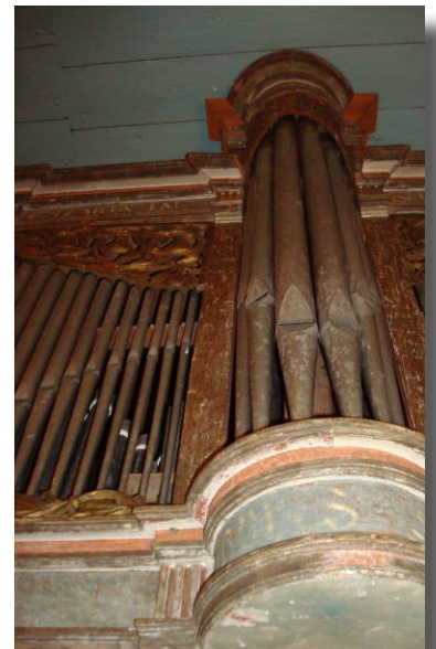
Kyrkorgel anno 1604

På bilden ovan syns kyrkans kantor spela till psalmerna vid vårt besök i Morlanda kyrka och det är på Norra Europas äldsta ännu fungerande kyrkorgel - från 1604!