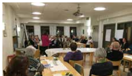
Diakonins sju bord, en utbildningskväll i Mariakyrkan om vad diakoni är, i samarbete med Uppsala stift och Sensus.

Kyrkorådet beslutade 2015 att Svenska kyrkan i Gävle ska arbeta med en diakonipastoral. Det är en processmetod som kan användas för att tydliggöra och prioritera kyrkans diakonala arbete i förhållande till omgivningens behov och tillgängliga resurser. Metoden bygger på en medvetandegörande process där såväl begreppet diakoni som behovet diakoni sätts i fokus, utifrån den samtid vi lever i.