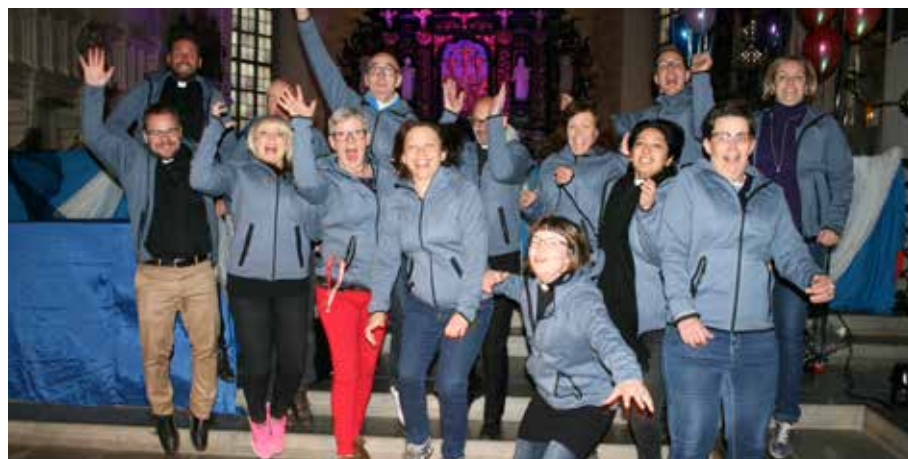
Konfirmandledarna gör ett glädjekutt för ett lyckat konfirmandarbete

Finalen på kvällen var en medryckande konsert med melodifestivalaktuella Ace Wilder, som förvandlade kyrkorummets till ett gungande dansgolv av lyriska ungdomar, konfirmander och ungdomsledare med "Inte som du tror" t-shirtar och händerna i luften.