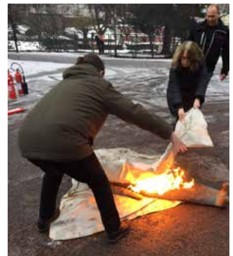
Brandskyddsutbildning för anställda