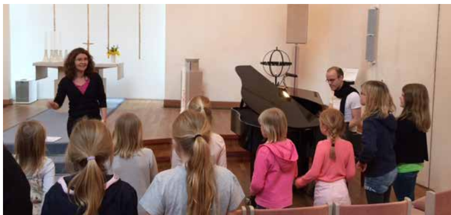
Körövning inför konserten "Jag är bra" i Björsjökyrkan i maj 2016