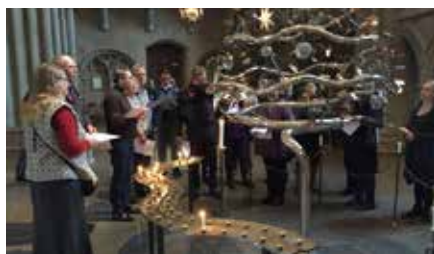
Studiebesök i Linköping: Stadsmissionens verksamheter, Linköpings stift, klosterverksamheten, Diakonins hus samt Slöjdens hus med workshop kring handens verk som själavård.

Under det andra steget har enheterna arbetat med att bedöma och prioritera behoven utifrån givna resurser. Här har en rad diskussioner förts ute i verksamheterna och samtalet har även lyfts med det omgivande samhället. Under två dagar i augusti arbetade kyrkorådet med underlaget och sammanställde en prioritering för det pastoratsgemensamma diakonala arbetet, dels en fördjupad satsning på diakonala strategier, dels på strategier för arbetet gentemot volontärer.