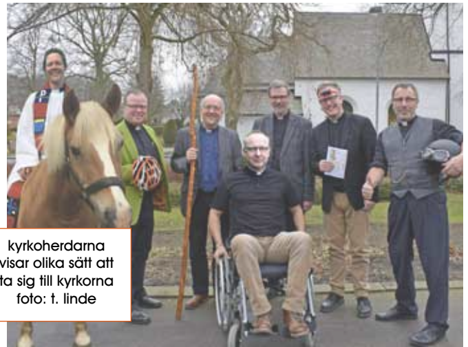
kyrkoherdarna visar olika sätt att ta sig till kyrkorna