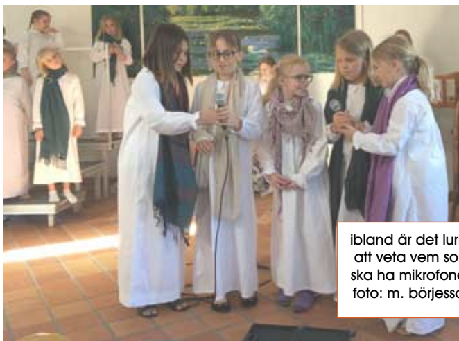
ibland är det lurigt att veta vem som ska ha mikrofonen