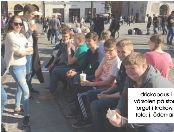
drickapaus i vårsolen på stora torget i krakow...

Trots den extremt tidiga väckningen på söndagen var det mestadels muntra, men trötta ungdomar som styrde kosan mot flygplats och mer än en slocknade tidigt på kvällen väl hemma i Sverige igen.