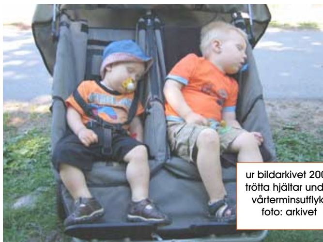
ur bildarkivet 2007 trötta hjältar under vårterminsutflukt