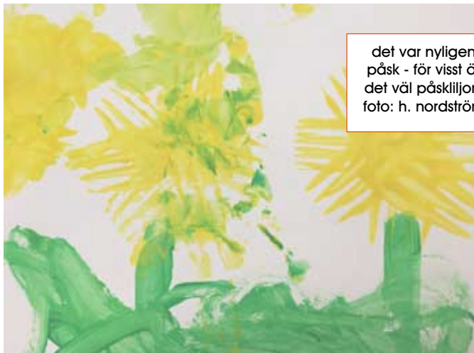
det var nyligen påsk - för visst är det väl påskliljor?