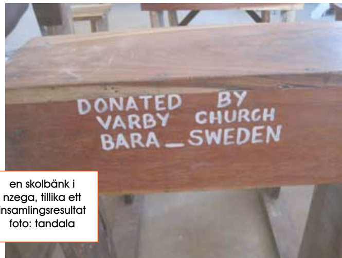
en skolbänk i nzega, tillika ett insamlingsresultat