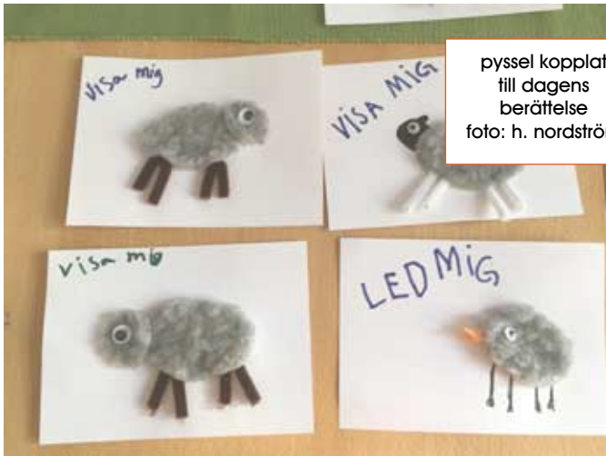
pyssel kopplat till dagens berättelse

Varför firar vi påsk? Vad har det med oss att göra idag att Jesus dog på ett kors och sedan uppstod?