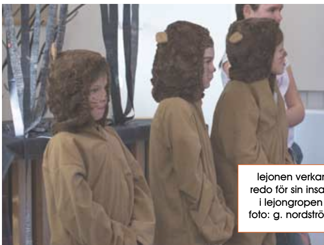
lejonerna verkar redo för sin insats i lejongropen