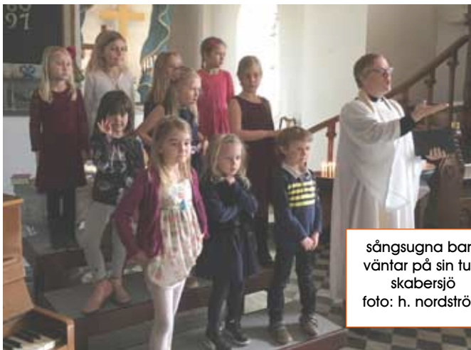
sångsugna barn väntar på sin tur i skabersjö