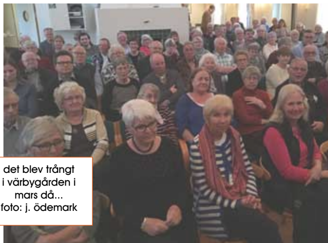
det blev trångt i värbygården i mars då...