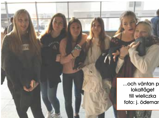
...och väntan på lokalståget till wieliczka