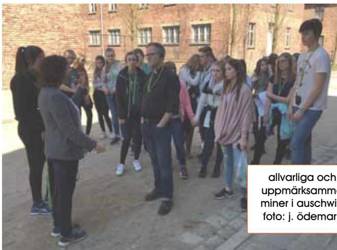
allvarliga och uppmärksamma miner i auschwitz