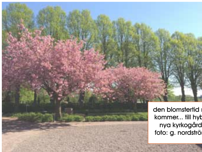
den blomstertid nu kommer... till hyby nya kyrkogård