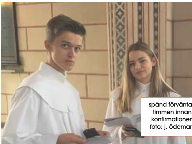
spänd förväntan timmen innan konfirmationen