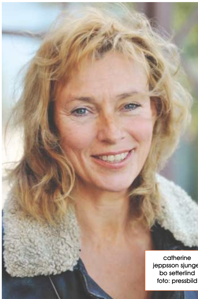
catherine jeppsson sjunger bo setterlind