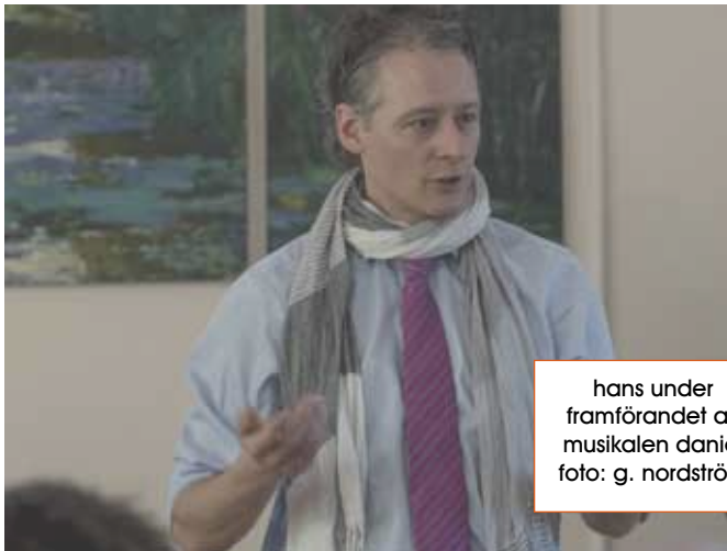
hans under framförandet av musikalen daniel