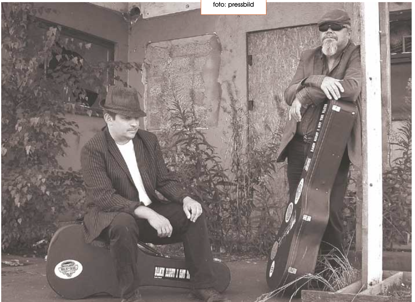
sommaren avslutas med blues i bara kyrka