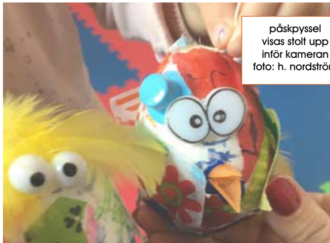
påskpyssel visas stolt upp inför kameran