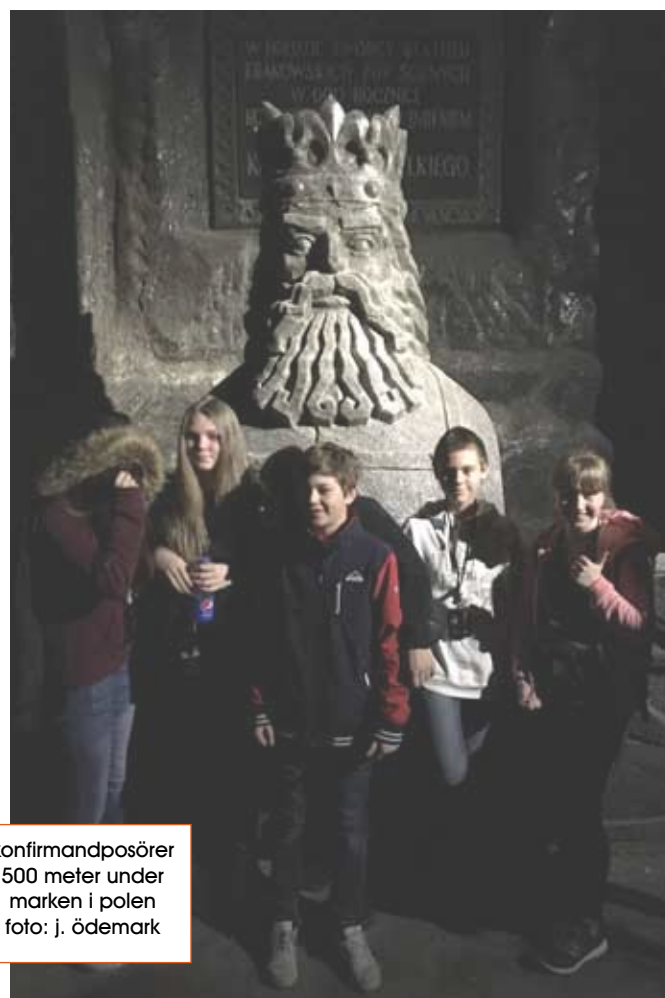
konfirmandposörer 500 meter under marken i polen