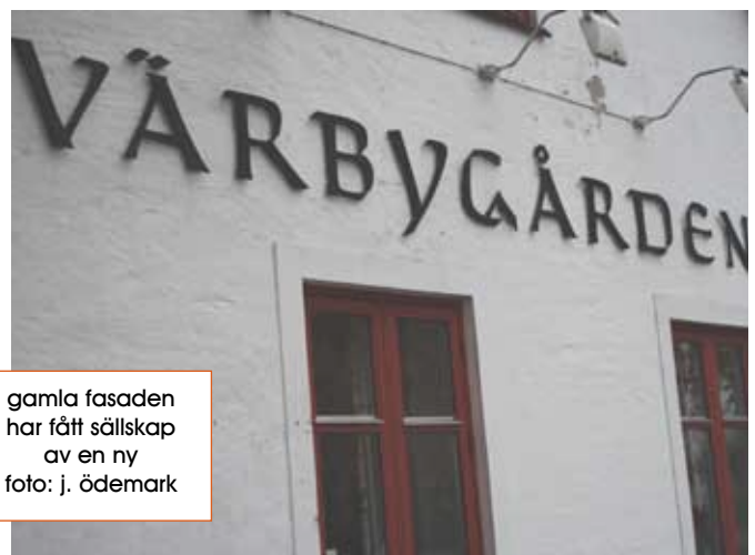
gamla fasaden har fått sällskap av en ny