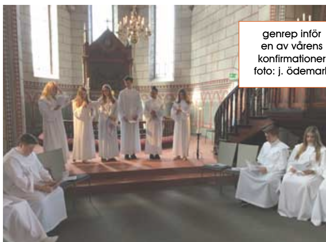
genrep inför en av vårens konfirmationer