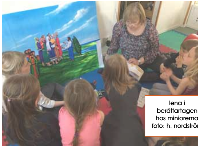
lena i berättartagen hos miniorerna