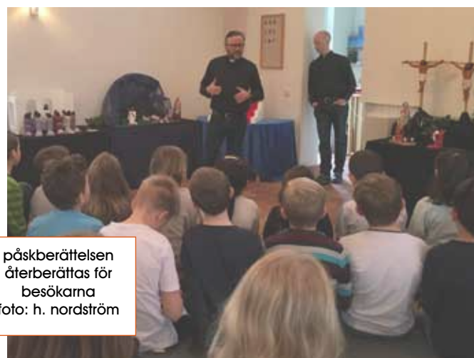
påskberättelsen återberättas för besökarna