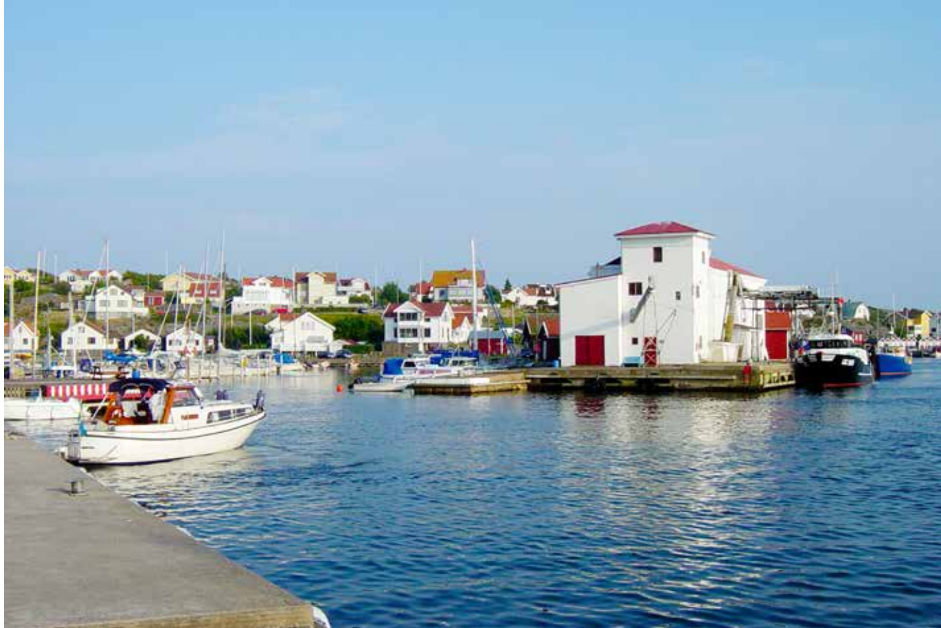
Öckerö församling arrangerar drygt 20 konserter på Bohus-Björkö och sex av de andra Öckeröarna i sommar.