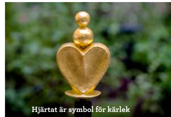
Hjärtat är symbol för kärlek