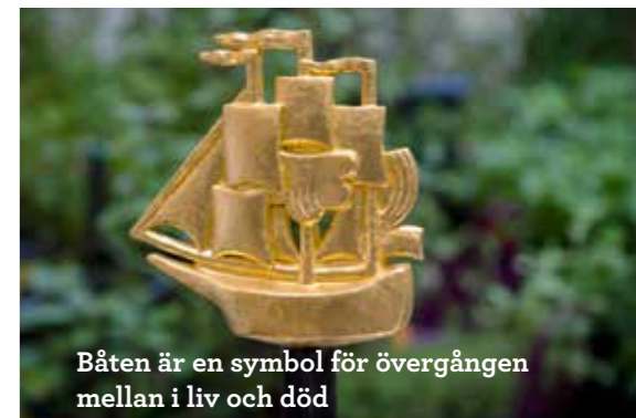
Båten är en symbol för övergången mellan i liv och död