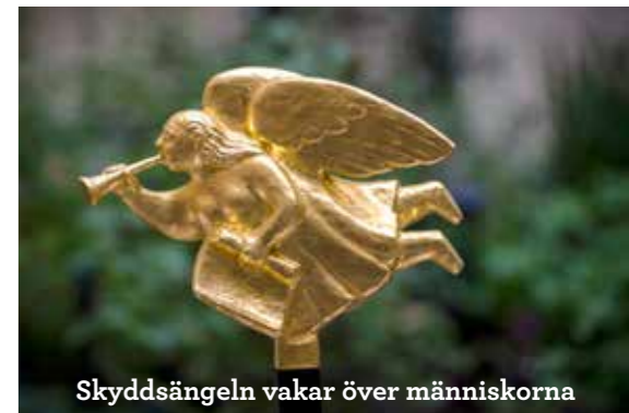
Skyddsängeln vakar över människorna