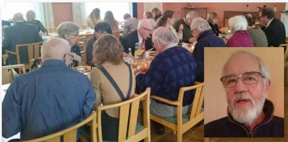
Kyrklunch i Tvärskogs församlingshem