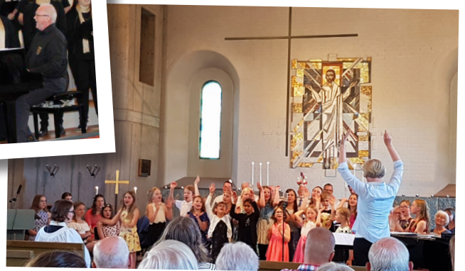
Bönsöndagens musikgudstjänst Tonfiskarna, Ceciliakören, Tjejkören och Vist kyrkokör