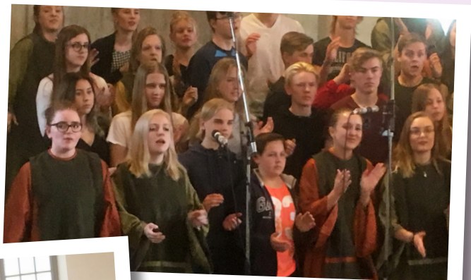
Bild från workshopen med Sanctity Gospel Choir i Vist kyrka den 7 maj