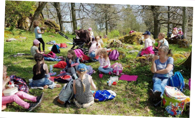
Utflykt till Bärbäcks Lillgård. Vist och Vårdsnäs barnkörer tillsammans med Kyrkbackens barn