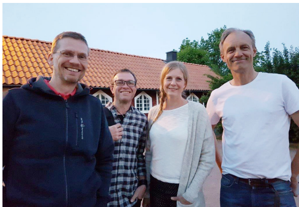
28 juni "Kärleken och livet" Jam Boys & The Marmalade Girl

28 juni Vårdnäs Vokalensemble och Jam Boys & The Marmalade Girl Låtar om "Kärleken och livet" med sång, bas, gitarr, fiol och trummor.