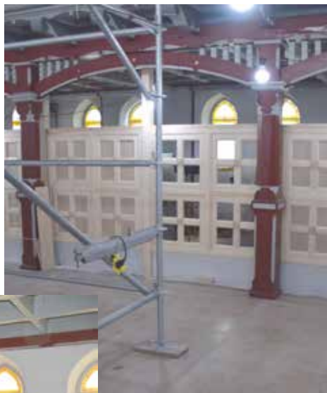
Bild till höger: Väggarna till den nya samlingsalen under södra läktaren börjar ta form.

Istället för att måla nytt blir det nu det gamla som åter kommer fram. Det har inte varit så svårt att få fram det gamla ytskiktet för underarbetet var inte särskilt välgjort. Det som är viktigt nu är att man gör ett gott arbete och inte forcerar fram processen. Återinvigningen blir sannolikt i januari 2018.