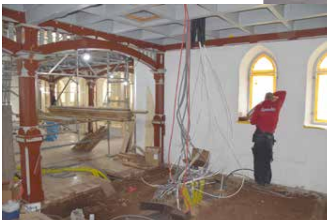
Bild till vänster: Framdragning av el till bl.a. mixerbord, klockringning och pentry som planeras under orgelläktaren.