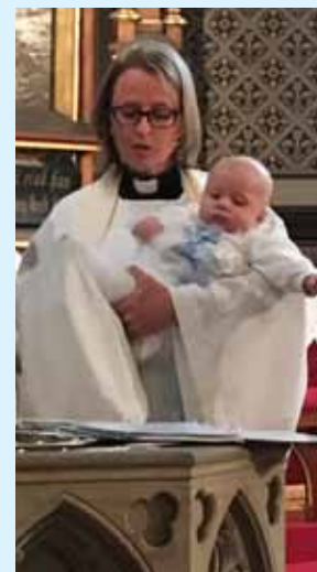
Dop av Levis i Bergen.