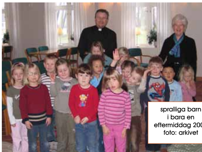
spralliga barn i bara en eftermiddag 2007