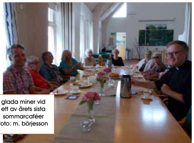
glada miner vid ett av årets sista sommarcaféer