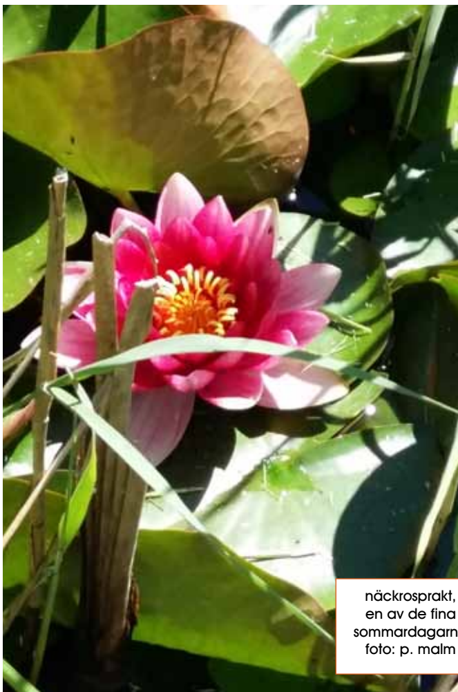
näckrosprakt, en av de fina sommardagarna