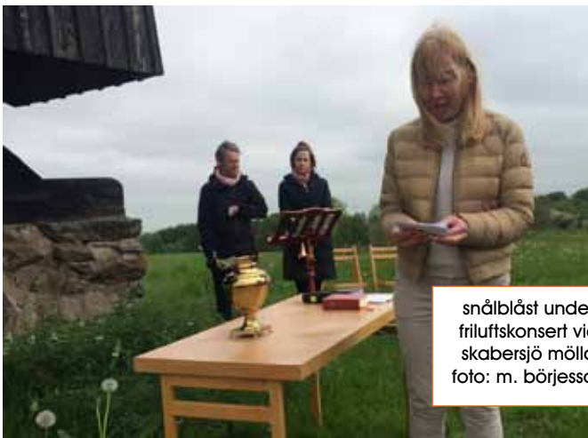
snålblåst under friluftskonsert vid skabersjö mölla