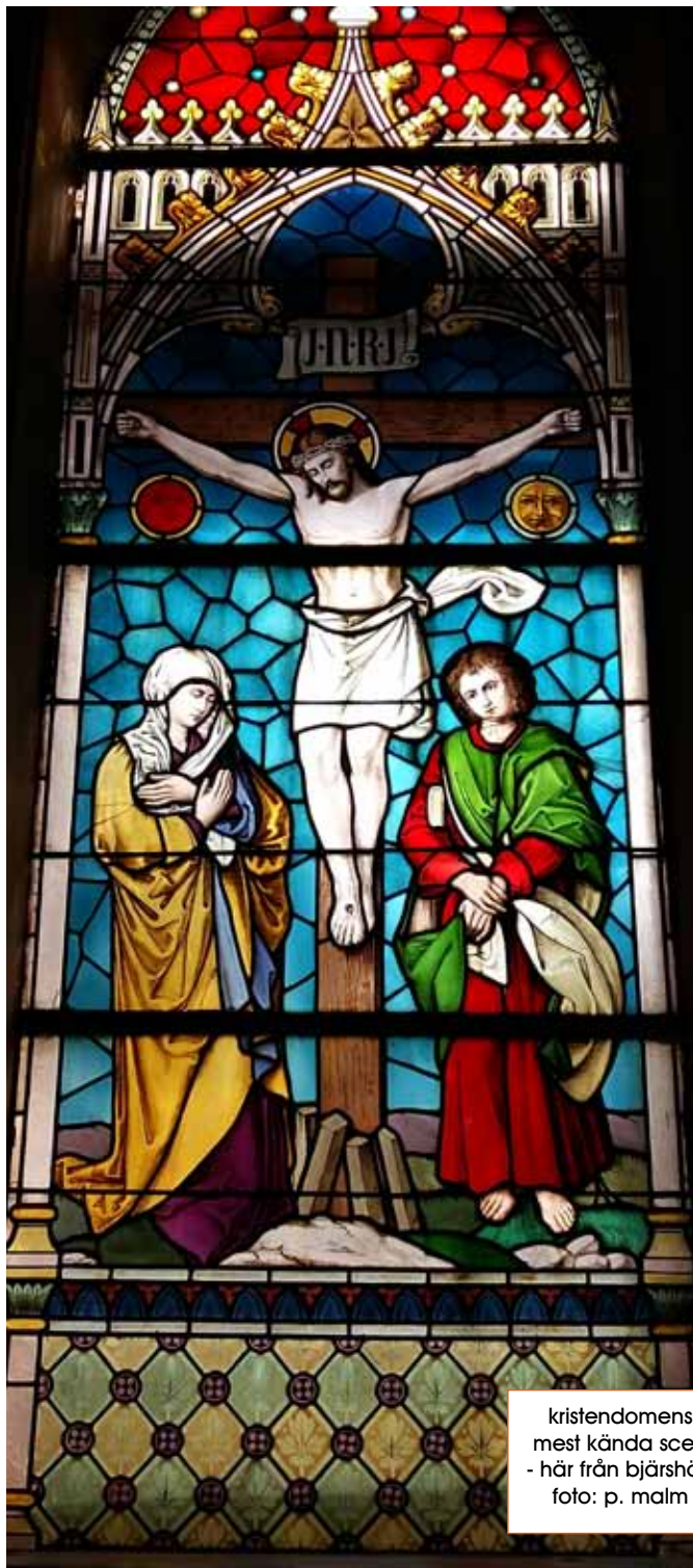
kristendomens mest kända scen - här från bjärshög