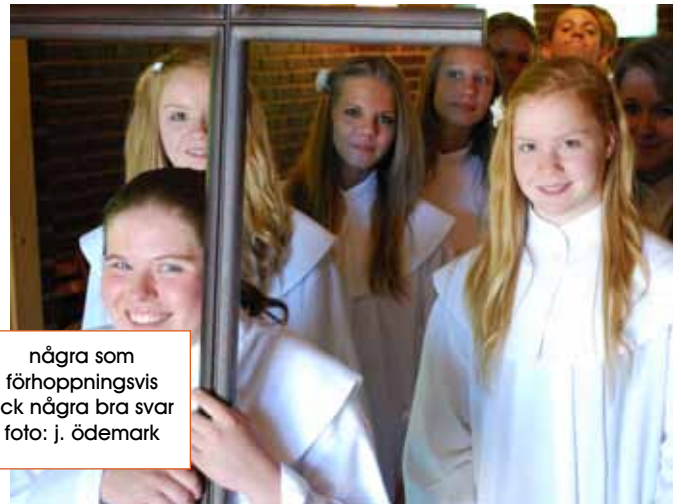
några som förhoppningsvis fick några bra svar