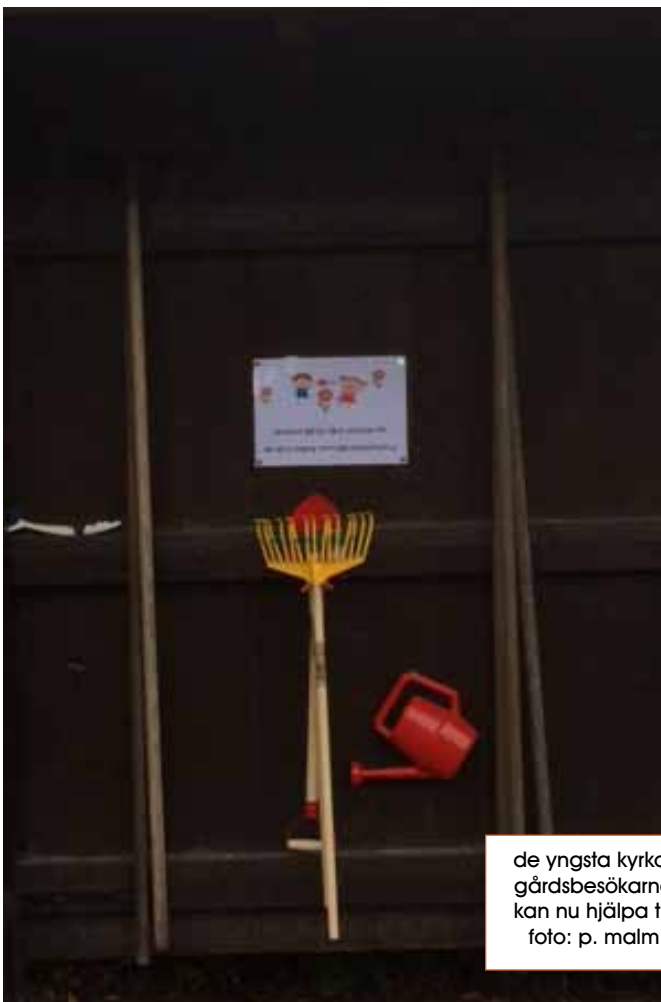
de yngsta kyrko- gårdsbesökarna kan nu hjälpa till