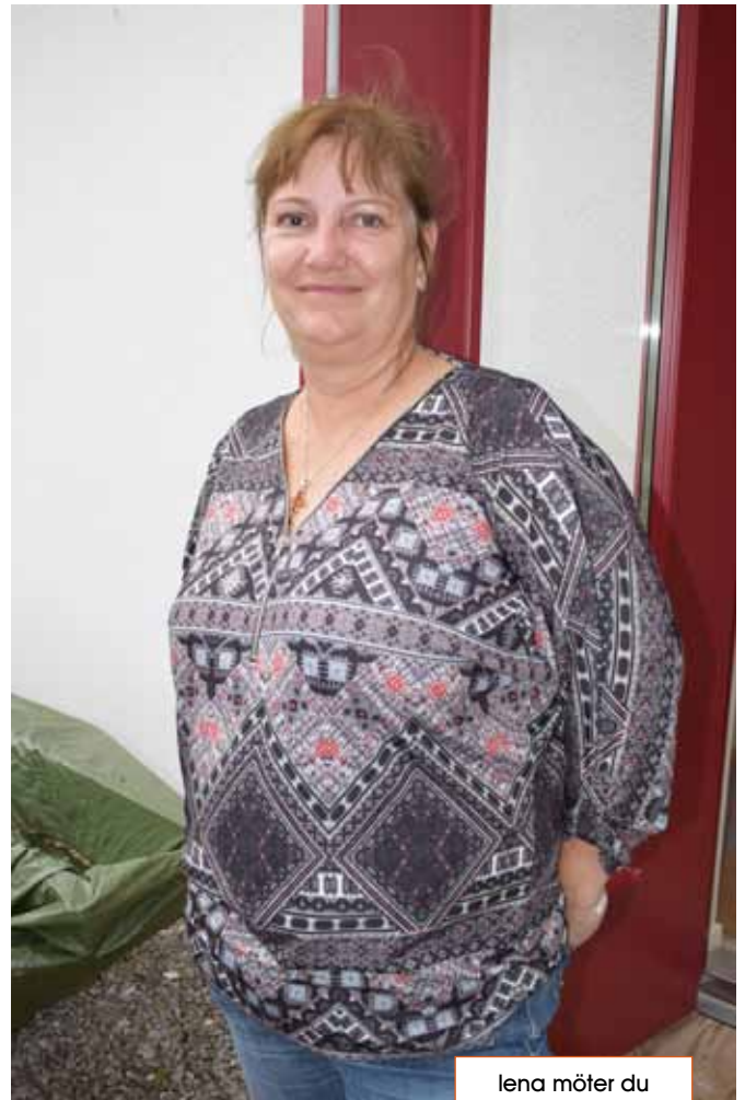
lena möter du på värbygårdens expedition i bara