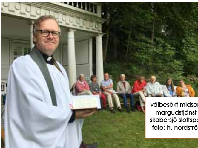
välbesökt midsommargudstjänst i skabersjö slottspark