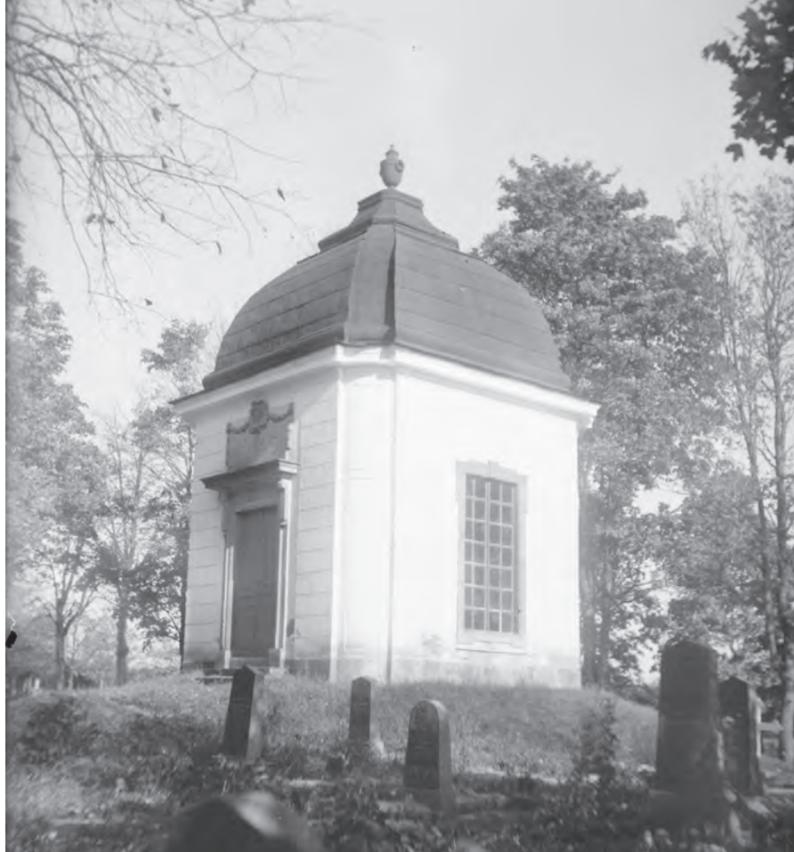
Familjen Stiernelds gravkor intill Vittinge kyrka i Uppland. Ett exempel på ett fristående gravkor, något som blev vanligare när gravsättningar inne i kyrkorummet förbjöds.