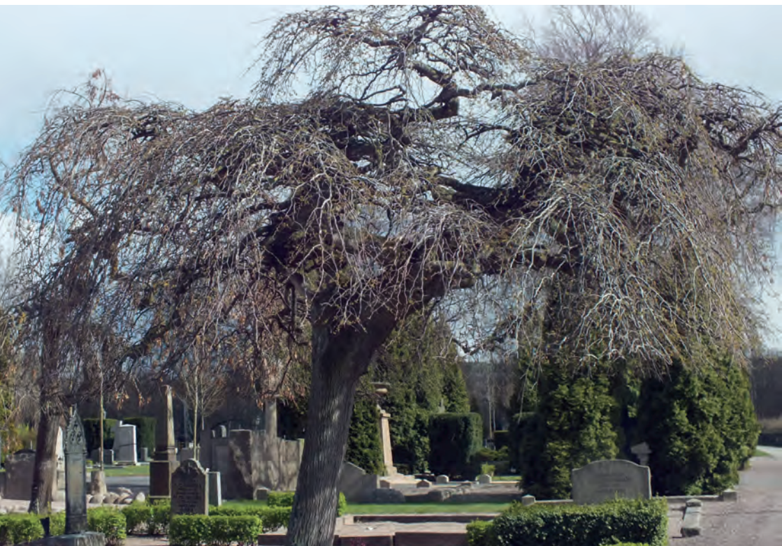
Alm med hängande grenar, ett karakteristiskt så kallat sorgträd, på Östra kyrkogården i Jönköping.

Svenska kyrkans arbetsgivarorganisation är arbetsgivar- och serviceorganisation för Svenska kyrkans församlingar, pastorat och stift. Arbetsgivarorganisationen ger även råd och stöd avseende begravningsverksamheten.