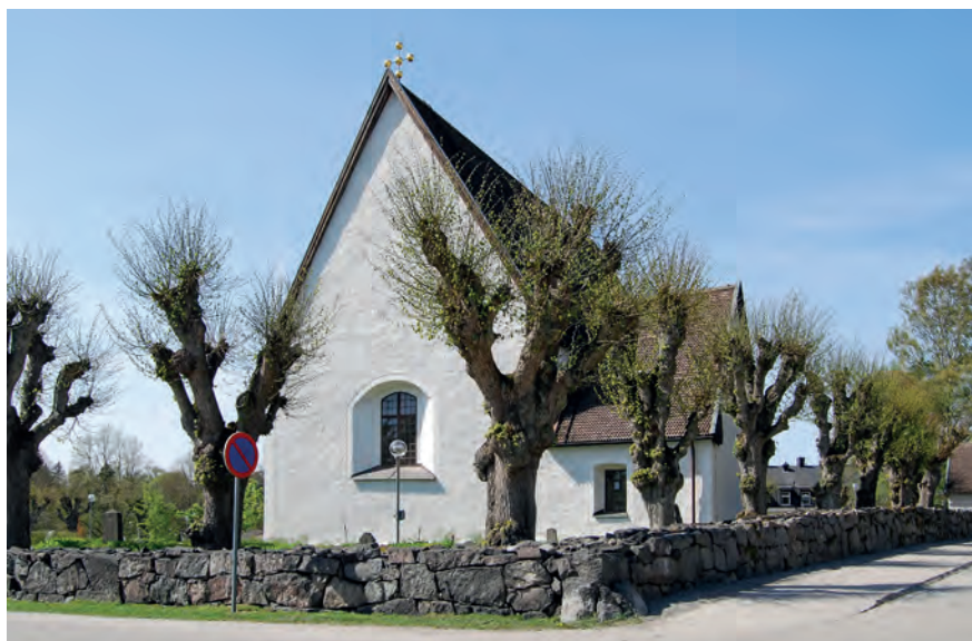
Lindarna intill kyrkogårdsmuren vid Täby kyrka planterades 1785 för att markera den dåvarande kyrkogårdens omfattning. Lindarna är ett tidigt exempel på medvetet gestaltad vegetation på en begravningsplats.