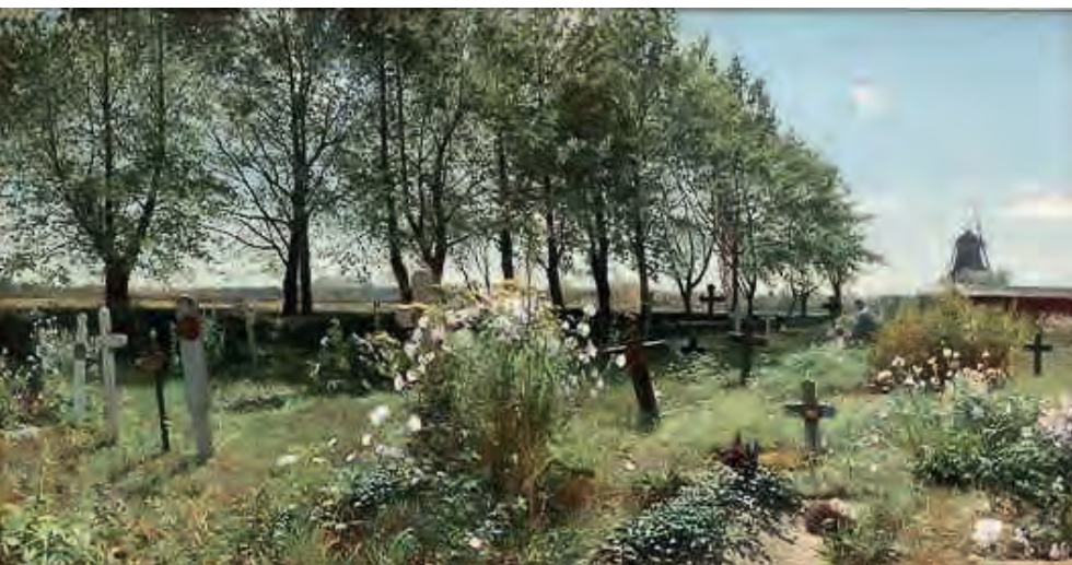
Kyrkogård i sommarsol. En målning av Gottfrid Kallstenius från 1887. Bilden visar en landsortskyrkogård innan gravstenar blev allmänt förekommande och kyrkogården fortfarande var gräsbevuxen. Här finns många perenner och en antydning till trädkrans. Bilden är något beskuren.