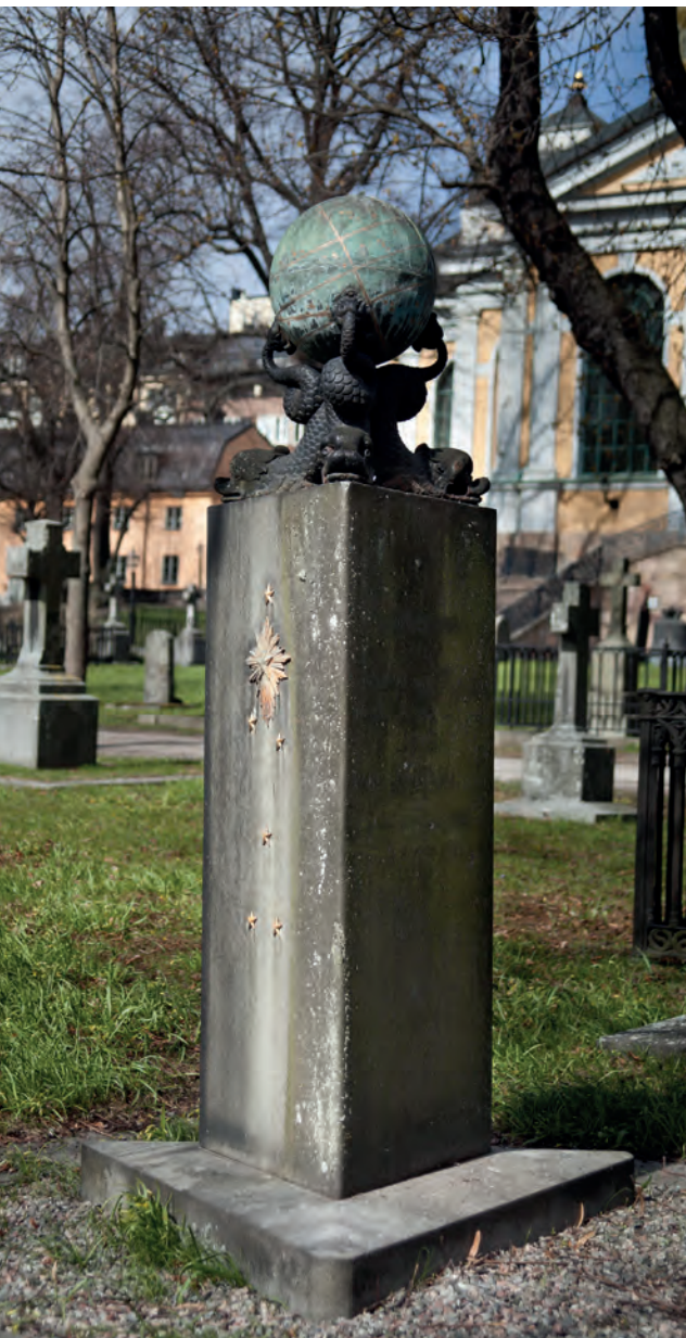
På Katarina kyrkogård i Stockholm finns detta ståtliga gravmonument i sten och metall.

förstärkt med stenpollare och kätting. Under ett fåtal decennier var staket i gjutjärn modernt. Ibland var gravplatsen markerad med klippt häck; i södra Sverige oftast av buxbom, längre norrut av ett hårdigare växtmaterial såsom måbär. Markytan innanför kunde vara täckt med sand eller grus. För att hålla gruset ogräsfritt behövde ytan krattas regelbundet. Ibland fick den av estetiska skäl ett dekorativt mönster.