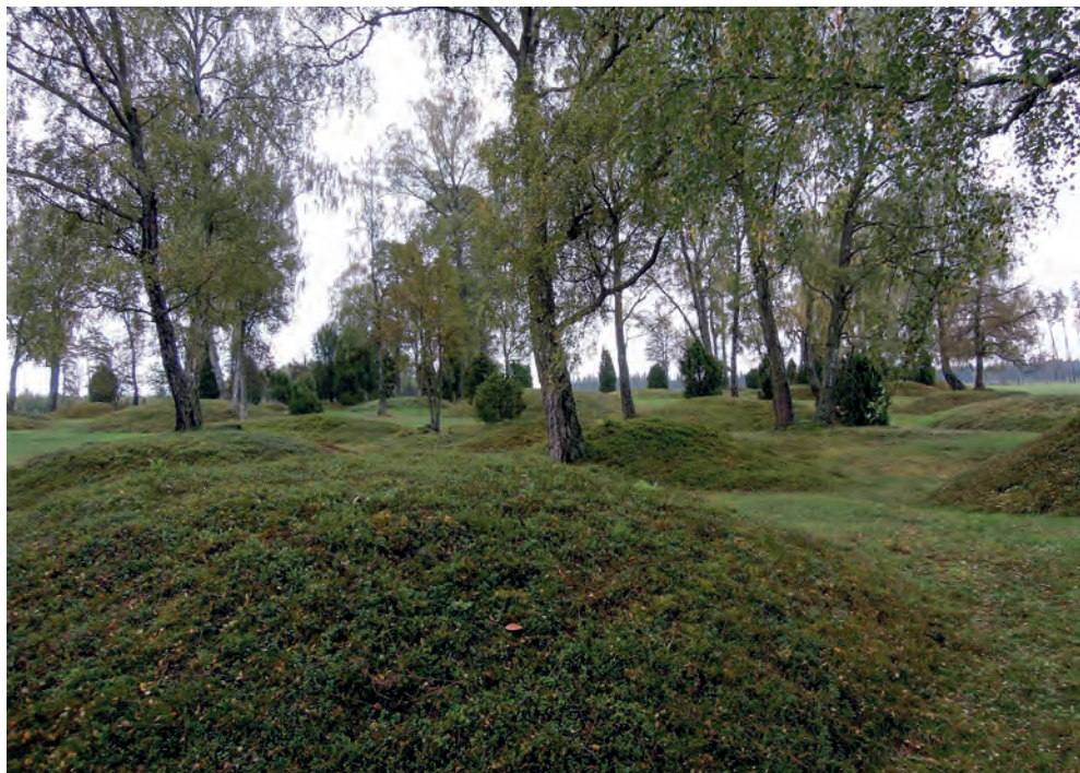
Gravfält från yngre järnålder, tiden före kristendomens införande i Sverige. Gravfältet är beläget i Ljungby kommun, intill Hallsjö kyrkoruin.

Medeltidens kyrkogårdar var främst formade utifrån nyttoaspekten, dels för att bereda de avlidna plats i jorden, dels för att kunna användas som marknadsplatser. Marken var bevuxen med gräs, som klockaren kunde ta