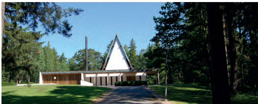
Silverdalskapellet i Söllentuna invigdes 1969. I källarplanet ryms ett krematorium med två ugnar. År 2016 kremerades i Sverige nästan åtta av tio avlidna.

Givetvis insåg förkämparna för kremerationens införande att behovet av mark för gravsättning skulle minska, men att denna begängelsemetod skulle påverka arkitekturen och karaktären på nya begravningsplatser blev en oanad konsekvens. För en urngravplats gällde – och gäller alltjämt – samma rättigheter och skyldigheter avseende gravrätten som för en kistgravplats. Urngravplatsen är dock betydligt mindre till ytan och gravanordningen blir därför mer måttfull och bättre anpassad till den nya skalan.