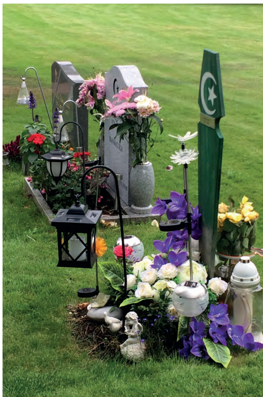
Några muslimska gravplatser på Västra kyrkogården i Halmstad. De döda ska begravas utan dröjsmål och vila på höger sida med ansiktet vänt mot Mecka.

Mångkulturen på svenska kyrkogårdar är inget nytt. Redan i 1686 års kyrkolag hävdades att de som tillhörde annan religion och dog i Sverige skulle "njuta fuller kyrkogård och lägerstad". Idag finns ett lagstadgat krav på att församlingar som är huvudmän för begravningsverksamheten ska tillhandahålla särskilda gravplatser för dem som inte tillhör något kristet trossamfund. Särskilda gravplatser för bland annat muslimer, judar, romer och bahaier finns som avskilda kvarter på många allmänna begravningsplatser.