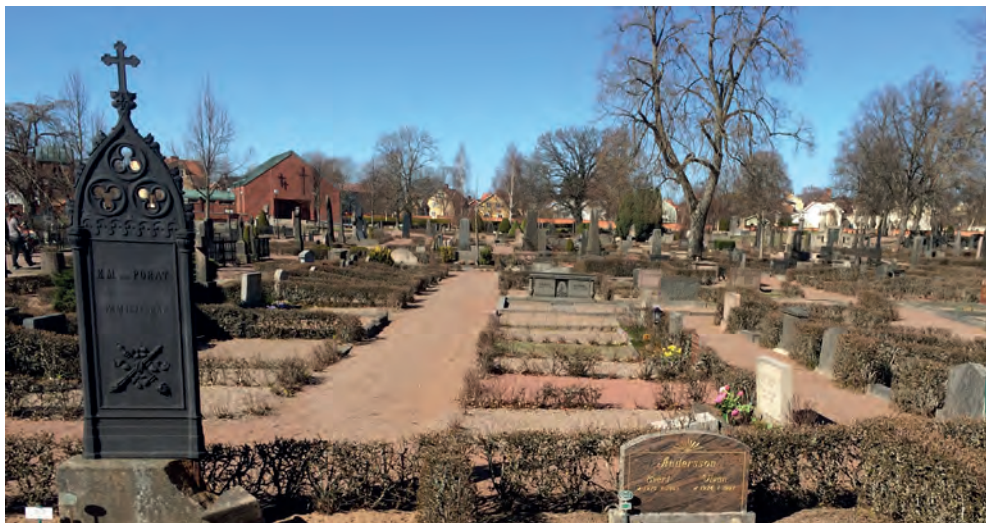
Ett helt kvarter med grusgravar i Eksjö. Modet med krattade gravar uppstod kring förra sekelskiftet. Till vänster i bild ett högre st gjutjärnsmonument.

kom således inte att bli begravda intill varandra, annat än om de kunde begravas samtidigt. Enligt den tidens uppfattning var det viktigt att äga en gravrätt. Ett illa omtyckt arbete bland kyrkogårdsarbetare var att gräva upp lik ur allmängravar för att gravsätta på en gravplats med nyttjanderätt som de anhöriga i efterhand lyckats få pengar till. Systemet med allmängravarna upphörde 1964 med lagen om gravrätt.