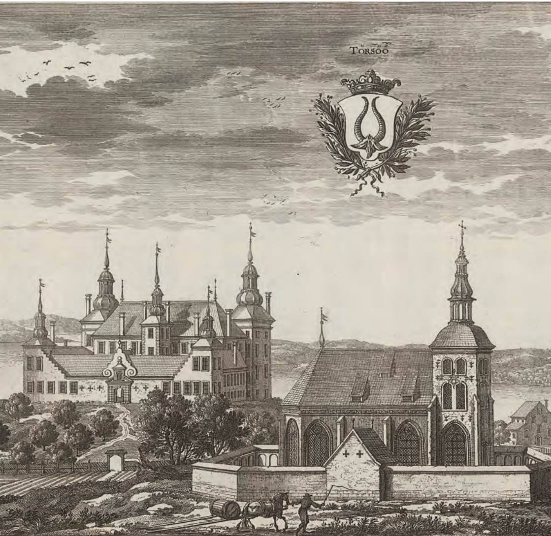
Tyresö kyrka, byggd 1636–1640 som gravkyrka till släkten Oxenstierna och slottskyrka till närbelägna Tyresö slott. Notera den kraftiga kyrkogårdsmuren som skiljer vigd jord från ovigd. Kopparstick av Erik Dahlberg 1661.