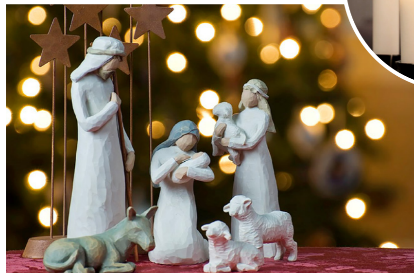
Samling vid krubban i Grinneröd på julafton.