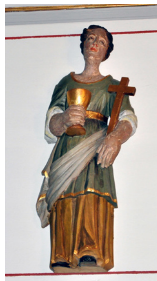
En av de fyra dygderna.

Altartavlan i Grinneröds kyrka är daterad 1672 men är ombyggd. Runt 1902 sattes en mellandel in i altartavlan, med fyra figurer. Dessa figurer är från sent 1600-tal. När kyrkan renoverades 1942 togs denna mellandel bort, och de fyra figurerna sattes upp på bröstvärtet (läktarskranket).