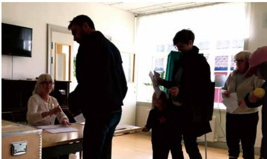
Från valdagen i församlingshemmet Trekanten i Vattholma