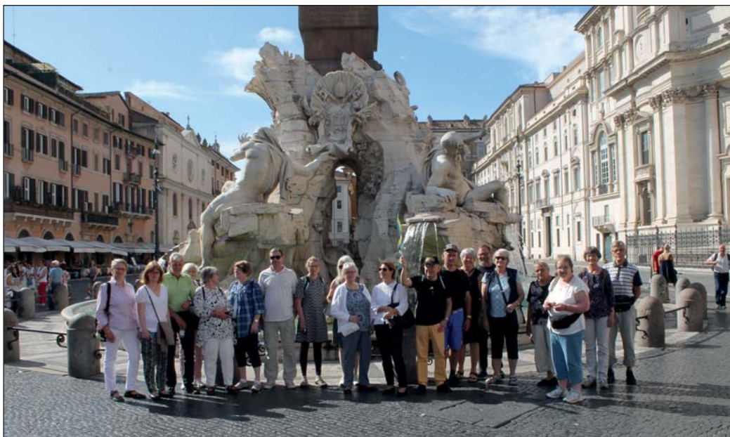
Hela gänget Romresenärer församlade.

tempel). Därefter hade vi två stopp till, det första vid kyrkan S Ignazio di Loyola, en vacker kyrka med en underbar takmålning och sedan Fontana di Trevi som är ett måste när man kommer till Rom.