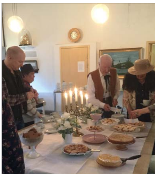
Besökarnas medhävda kakor räckte till en hel buffé som det höggs in på efter husförhöret.