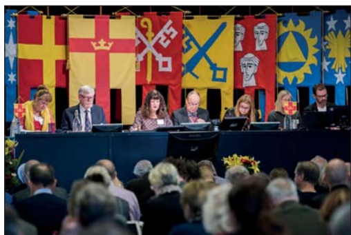
Kyrkomötets plenisal där debatter förs och besluten tas.

– Jag flyttade från Filipstad 1992, faktiskt 25 år sen inser jag nu. Är i stan kanske tre gånger per år. Med jobb och stor familj – fru och fyra barn – blir det inte så mycket fritid över, men om jag har nån så blir det gärna en cykeltur.