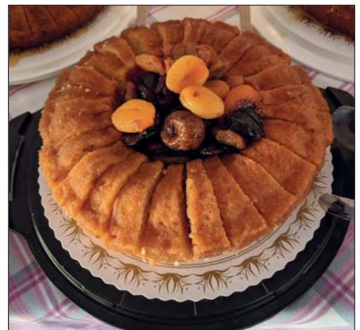
Goda bakverk med inspiration från Luthers egen tid dukades upp i Kyrkans hus.

Men fortfarande, efter 500 år, är Martin Luthers avtryck i historien ofrånkomliga.