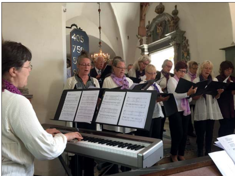
Körerna från Brattfors och Nordmark sjöng några sånger under en högmässa i Herrestad.