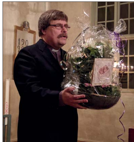
Blommor och presenter överlämnades från församlingen och byn.