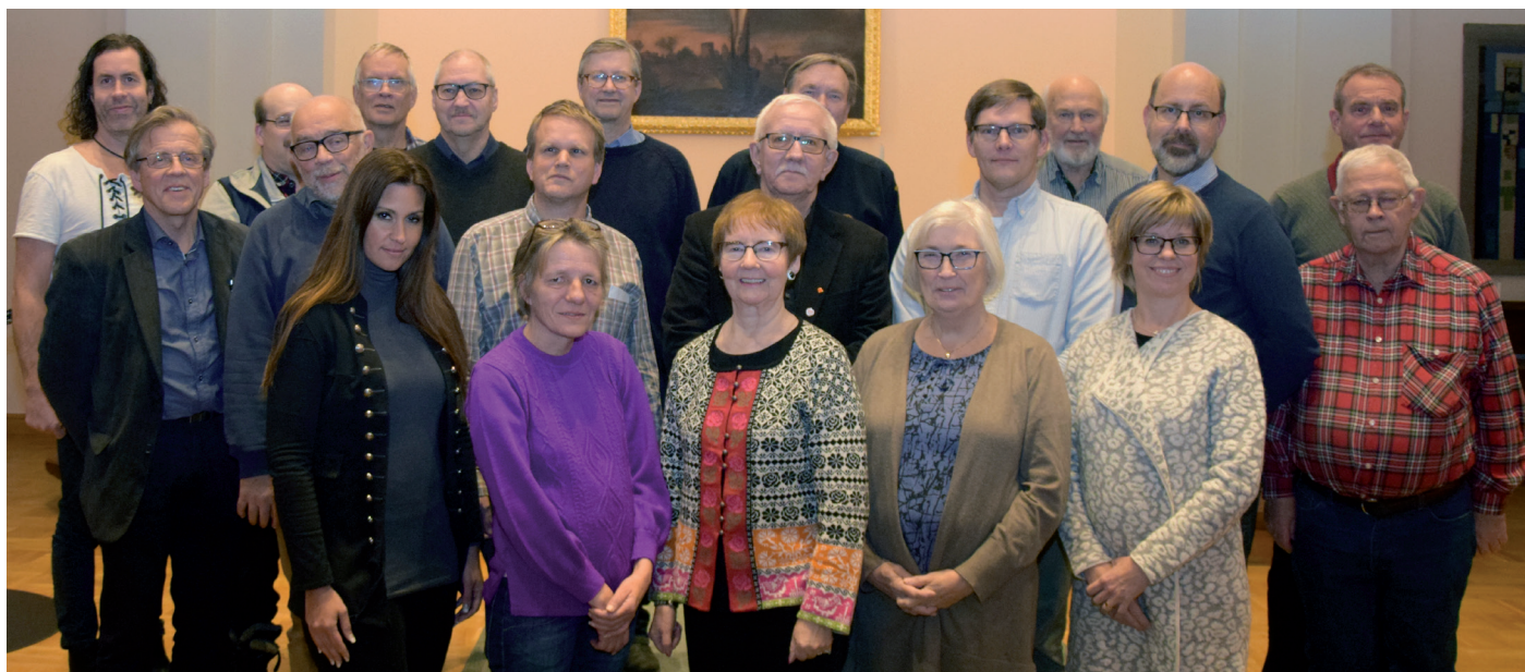
Här är nya kyrkofullmäktige i församlingen för mandatperioden 2018-2021.