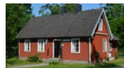
I Grönadals missionshus: