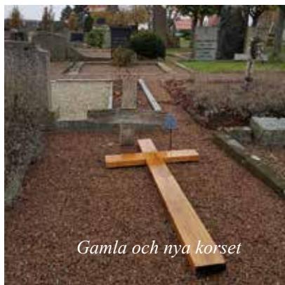
Gamla och nya korset