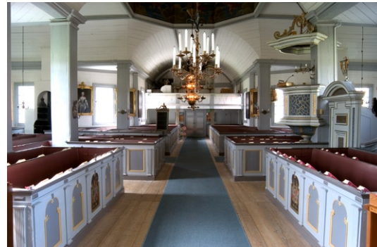
Kyrkorummet åt väster.