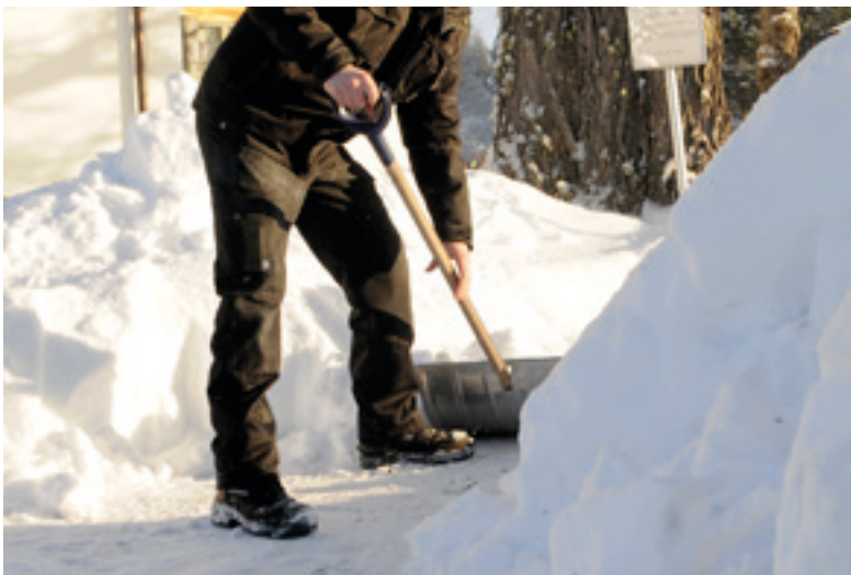
Alla intagna på Asptuna arbetar. Man kan till exempel ansvara för att skotta snö eller att ta hand om anstaltens biodling.