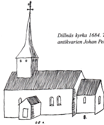
Dillnäs kyrka 1684. Teckning av antikvarien Johan Peringskiöld.

och med en sakristia i norr. Senare under medeltiden förlängdes kyrkan åt väster (snedstreckat på skissen) och ett vapenhus byggdes på sydsidan. Därmed fick kyrkan det utseende som återges på en teckning av Johan Peringskiöld, år 1684.