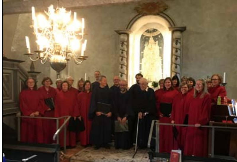
Ba-Ra kören