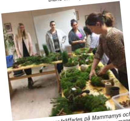
Ett gäng mammor träffades på Mammamys och gjorde kransar och annat julpysell tillsammans.