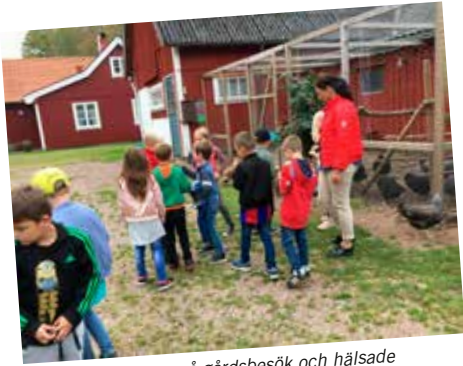
Kyrkis var på gårdsbesök och hälsade bland annat på höns.