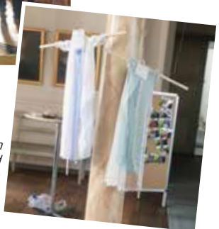
Under sommarkyrkan fanns en utställning med dopkläningar från olika tider och i skiftande stilar upphängd i kyrkan.