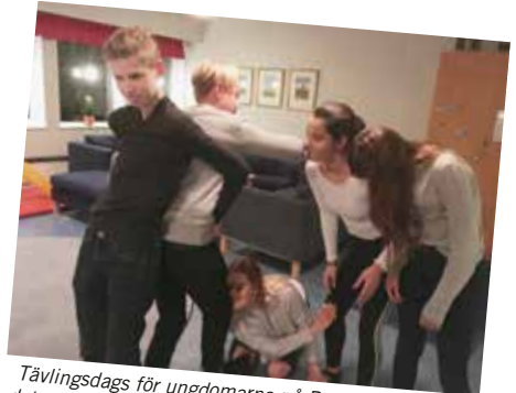
Tävlingsdags för ungdomarna på Pax. Hur länge går det att hålla fast en lapp mellan ett knä och en kind?