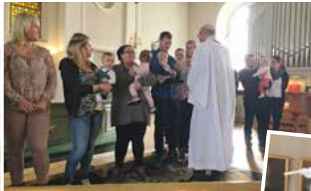
De barn som har döpts i församlingen senaste halvåret fick vid en gudstjänst komma och hämta sin dopängel.