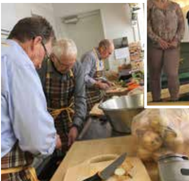
Första torsdagen i varje månad tar soppgubbarna plats i köket för att fixa mat till alla som kommer på sopplunchen.