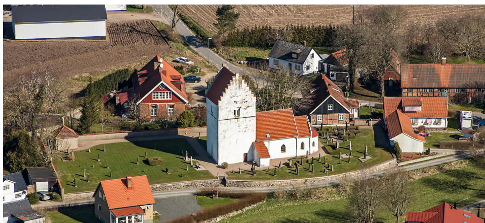
Ramsåsa kyrka från ovan