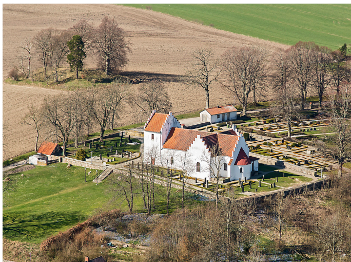
Rödninge kyrka från ovan

I FLERA ÅR har vår församling haft en kortare pilgrimsvandring mellan Rödninge och Ramsåsa. Ena året började vi i Rödninge för att avsluta i Ramsåsa och göra tvärtom nästa år. Ramsåsa kyrka varit stängd under flera år i väntan på inre mögelsanering men i vår är det dags att öppna kyrkan. Vad passar väl bättre än att göra det i samband med vår pilgrimsvandring i år?