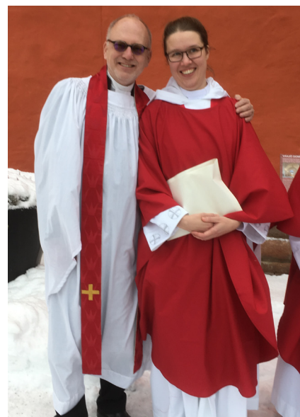
Utanför Växjö domkyrka efter prästvigningen 4 februari