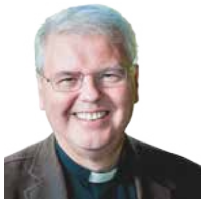
Kyrkoherden HAR ORDET...