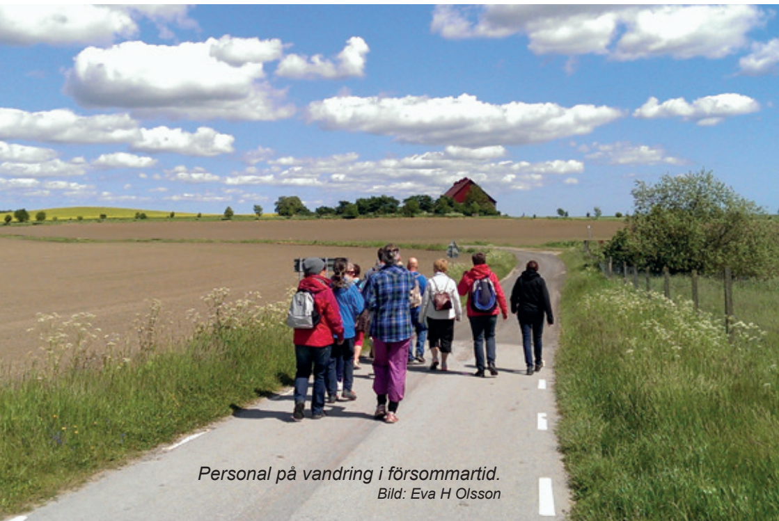
Personal på vandring i försommartid.