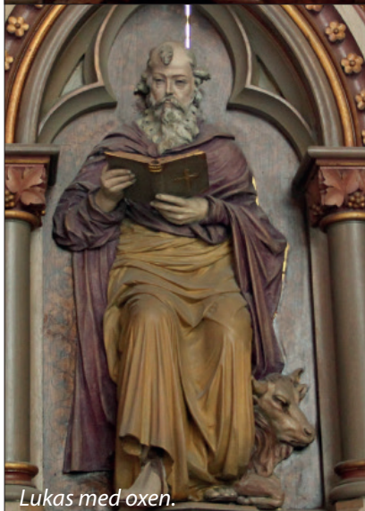
Lukas med oxen.