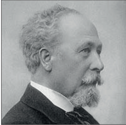
Helgo Zettervall 1831-1907

Vem var mannen som skapade en av de främsta nygotiska kyrkorna i Sverige? När man läser gamla gulnade tidningar, dokument och sköra papper börjar en man skymta fram som inte bara kunde rita hus. Han var också kunnig i teologi och liturgik, from, lite konservativ med en lätt blinkning åt det katolska. Man hittar också drag av romantik och mysticism.