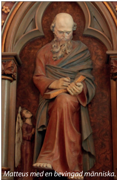
Matteus med en bevingad människa.

Predikstolen med de fyra evangelisterna är ursprunglig från 1893.