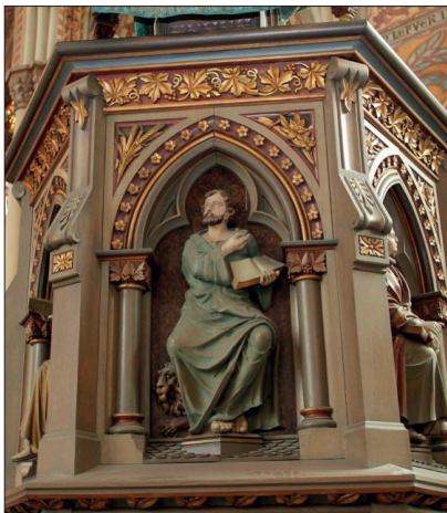
De fyra evangelisterna pryder predikstolen från 1893. Här sitter Markus med sin evangelistsymbol, lejonet.

Predikstolen flyttades från korets södra sida längre in i kyrkorummet i hopp om att förbättra hörbarheten.