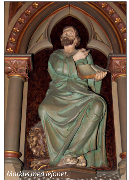
Markus med lejonet.