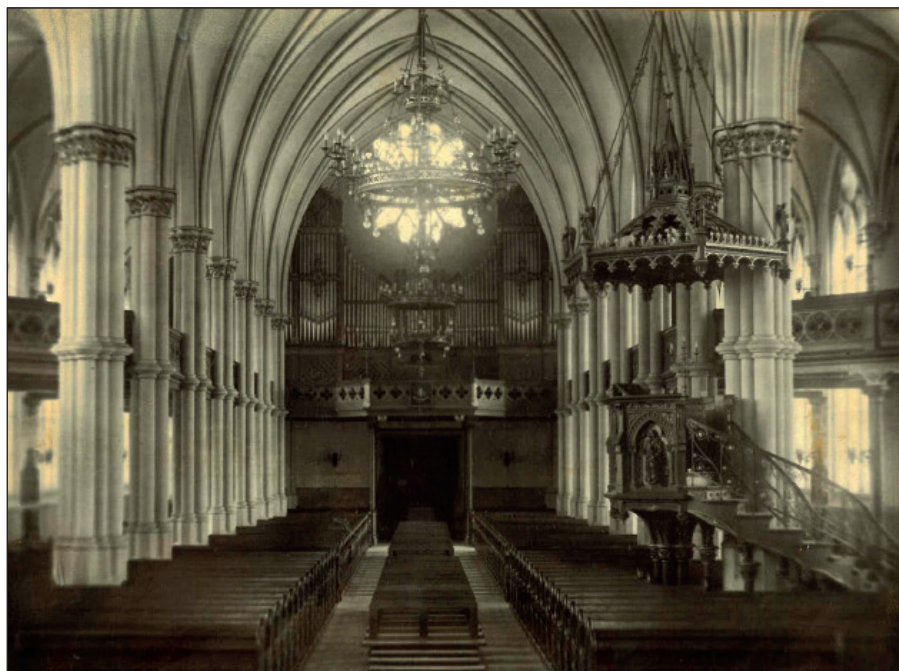
Bild från tiden när kyrkan rymde 1685 sittplatser. 1940 togs läktarna längs med längskeppet bort och kyrkan vann mer rymd och ljus. De lösa bänkarna i mitten försvann och de fasta bänkpartierna breddades mot mittgången.

Det var inte bara kung Oscar som var begåvad med en poetisk ådra. Även Helgo Zettervall tyckte om att uttrycka sig verbalt. Han diktade under pseudonymen Nikola. Nikolaus var ett av hans andra förnamn. I citatet till höger skriver han att "Ingen konst står närmare mysticismen än arkitekturen". Det tål att mediteras över. Kanske hänger det ihop med hans förmåga att se helheten. Han lämnade inget åt tillfälligheter. Allt var teologiskt och