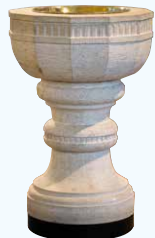
Dopfun i Jämshögs kyrka