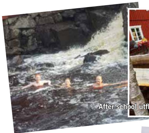
After school utflykt