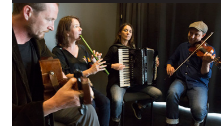
29/7 NORDIC SESSIONS