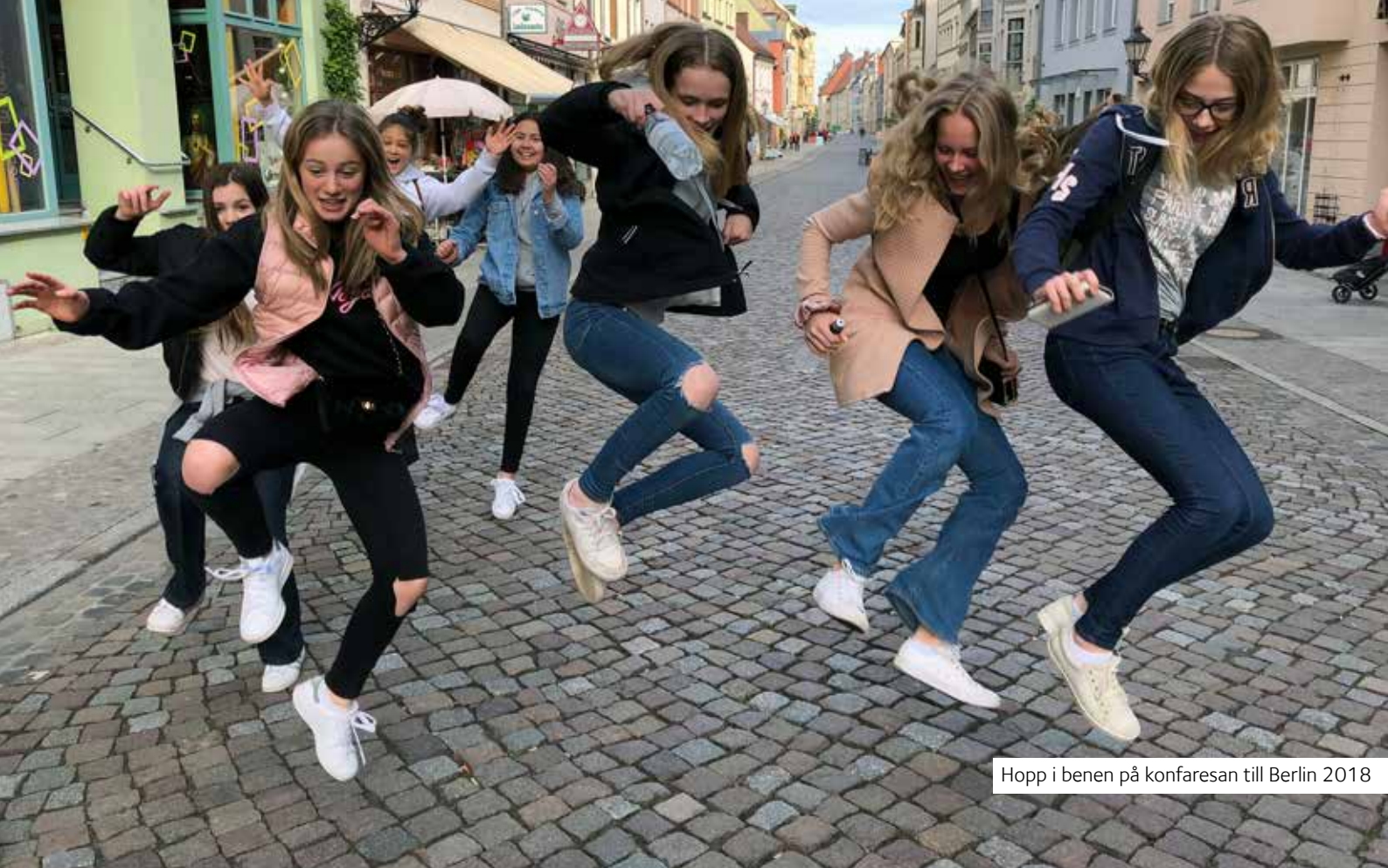
Hopp i benen på konfairesan till Berlin 2018