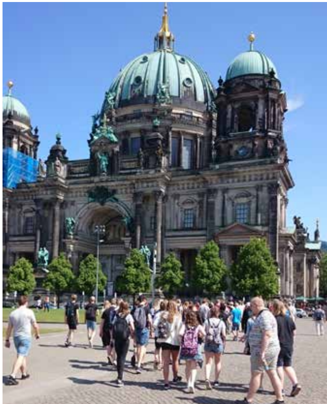
Konfirmandgänget på väg till Berlins lutherska domkyrka, där vi fick uppleva en fin gudstjänst i Taizéanda.

När detta är klart är förhoppningen att vi ska kunna fortsätta med att se över den inre sidan av kyrkan.