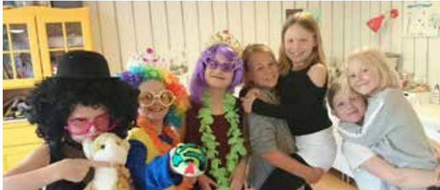
Himlakul i Påryd

På pingstdagen var det församlingsfest och terminsavslutning för barnverksamheten, en glädjefylld och härlig gudstjänst.