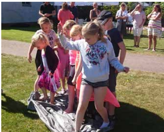
Årets vårfest i S:t Olofs kyrka