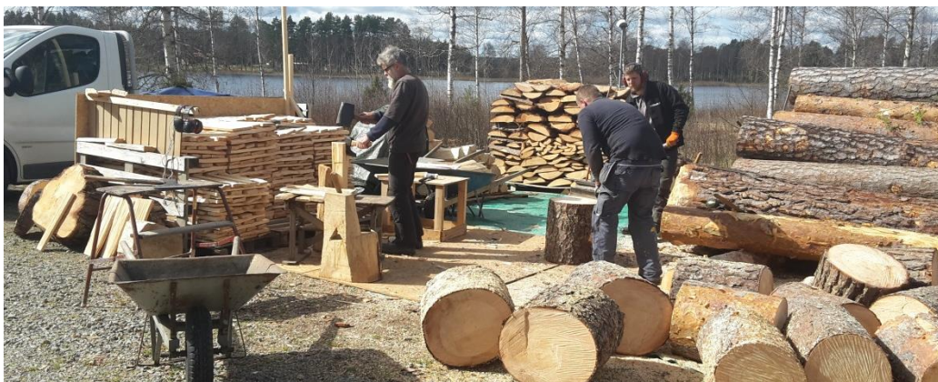
Tillverkning av ämnen för takspån.