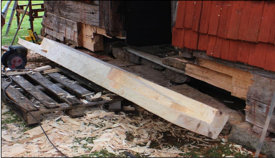
Utbyte av sylstocken mot öster.