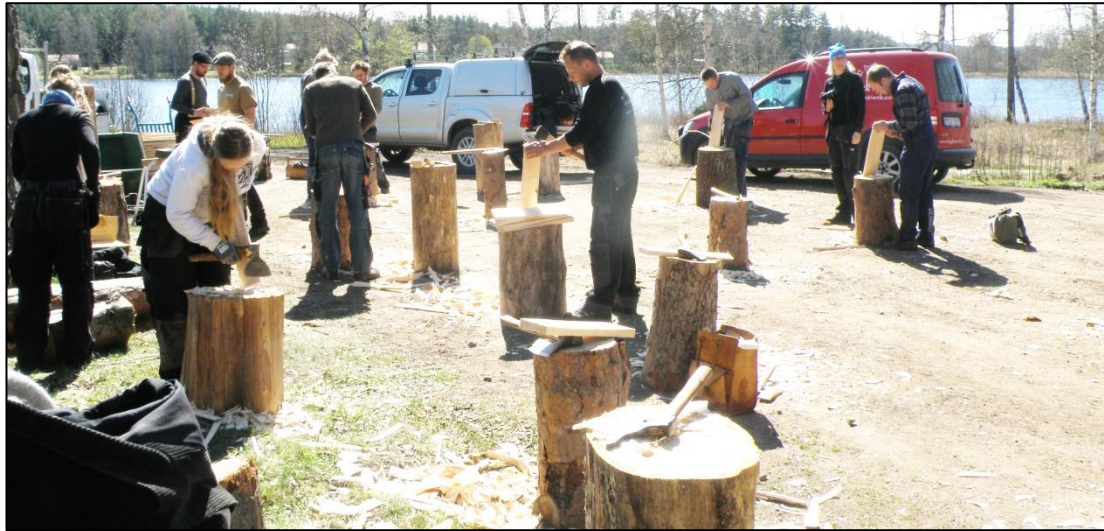
Tillverkning av takspån.