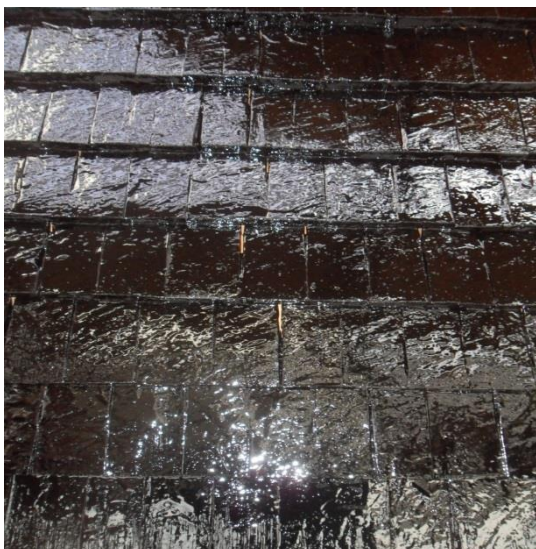
Tjärning har utförts efter ett recept från 1700-talet, bestående av trätjära och kimrök.