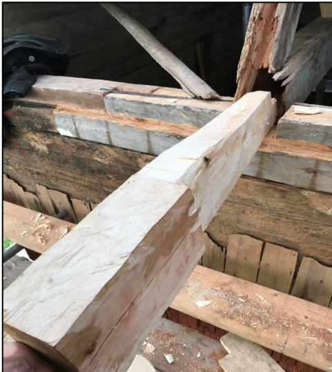
Reparation av bindbjälken.