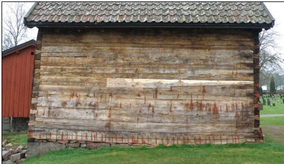
Lagningen av söderväggen efter rötskadan.